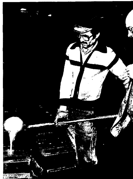
Zo zal het nooit meer zijn. De vormen worden hier nog op ouderwetse wijze volgegoten.

Zo liep de communicatie tussen de departementen en de werkers in het veld bepaald niet volgens het boekje en dat is dan zacht gezegd. Ondanks de onophoudelijke publicatiestroom in de regionale pers en de noodsignalen van het Arnheems Openluchtmuseum bleek bijvoorbeeld de Rijksdienst voor de Monumentenzorg totaal niet op de hoogte van de fatale ontwikkelingen. Door