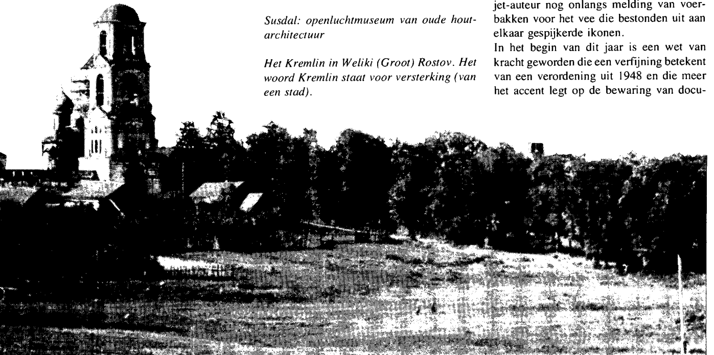
Het Kremlin in Weliki (Groot) Rostov. Het woord Kremlin staat voor versterking (van een stad).