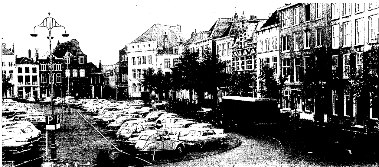
Pleinwanden van de Brink gezien vanaf de Waag, richting Goldstraat, nu.