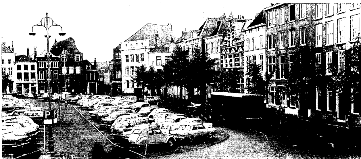
Pleinwanden van de Brink gezien vanaf de Waag, richting Goldstraat, nu.

Het winnende ontwerp van Hans Witte en Kees van de Broek heeft alle mogelijkheden in zich om dit evenwicht weer te herstellen. De karakteristieke verschijningsvorm van de Brink wordt in het plan behouden, zelfs benadrukt, door een overzichtelijke, rustige ruimte-indeling. Tegelijk versterkt het ontwerp de verblijfsfuncties op het plein. Dit wordt niet zozeer bewerkstelligd door het verwijderen van vrijwel al het autoverkeer. Het is de lange arcade, gesitueerd aan de westzijde, die de wezenlijke oplossing