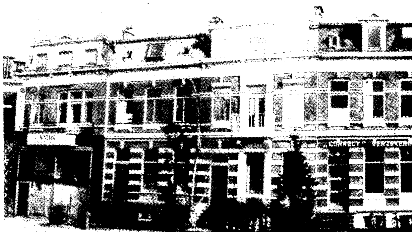
Karakteristieke rij gevels met rijke detaillering in de St. Annastraat.