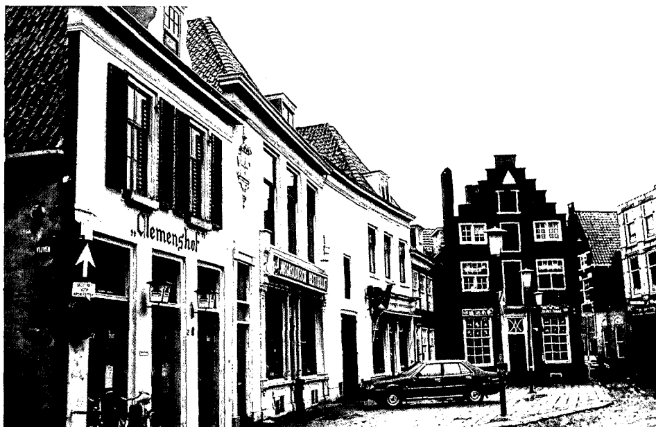
De noordwestelijke wand van de Hof met links de ingang van de Vijver en rechts op de achtergrond de Lavendelstraat.

Tot de zeer belangrijke hulpbronnen bij de studie van de vroege middeleeuwen horen in het algemeen plaats-, water- en veldnamen. In de oudste naamgeving leeft vaak de herinnering voort aan de oorsprong van bepaalde vestigingen. In Amersfoort blijkt zelfs heel duidelijk de structuur van een oude vroonhof uit nog bestaande straatnamen. Uit latere schriftelijke bronnen was al duidelijk geworden, dat de oorspronkelijke 'curtis' een com-