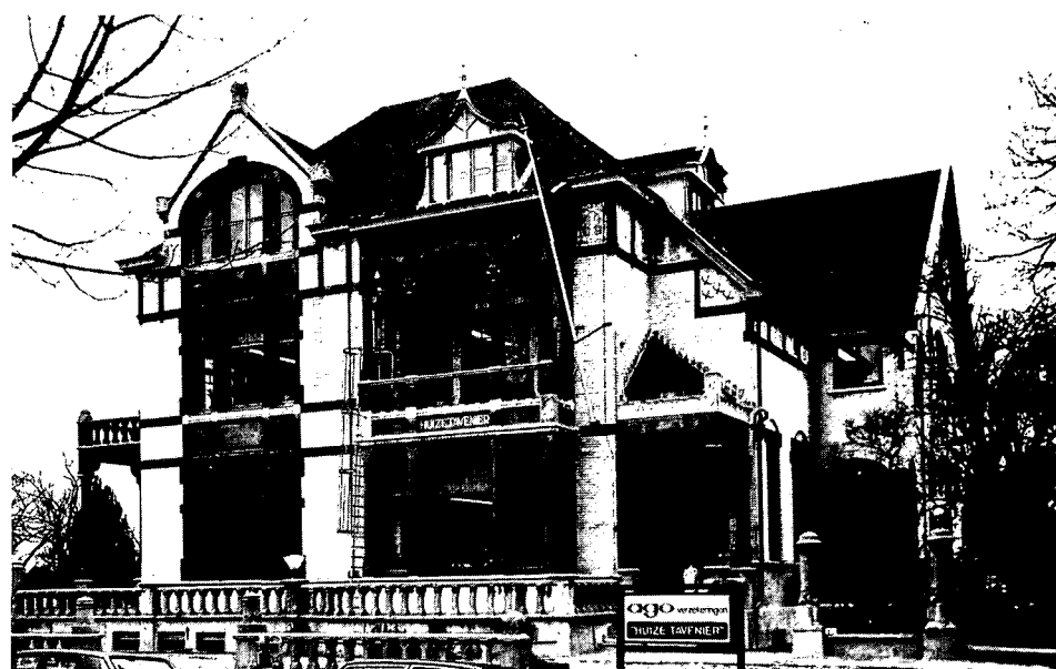
Onder: Huize Tavenier, Zetel van AGO.