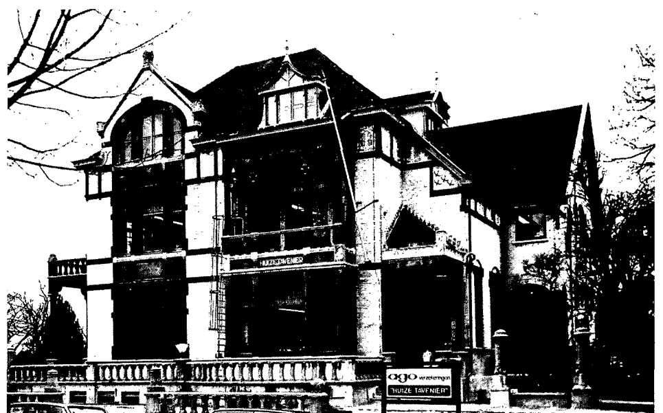
Onder: Huize Tavenier, Zetel van AGO.