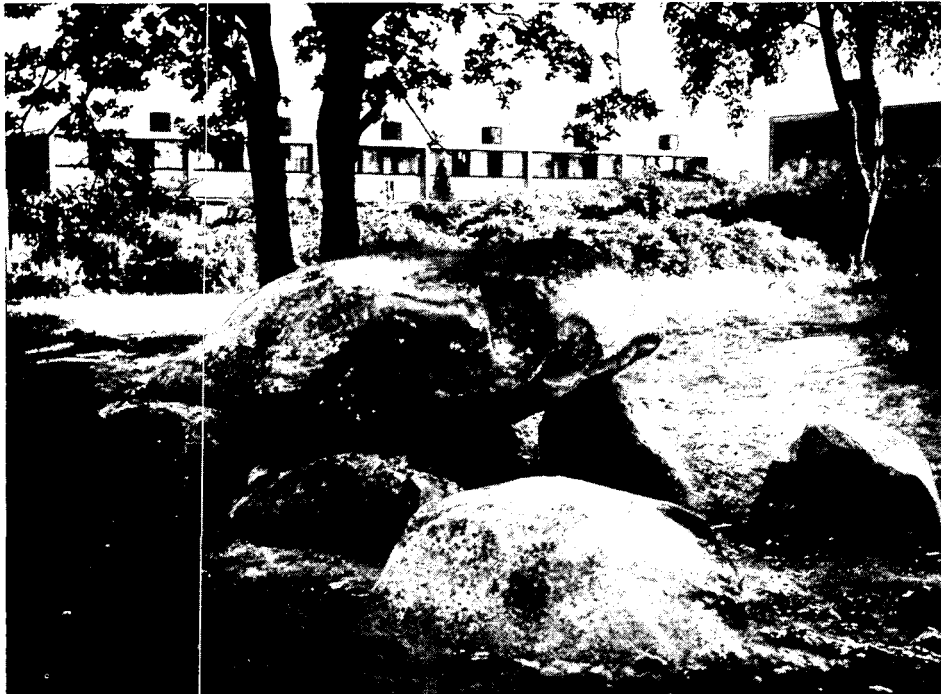
Hunebed in de woonwijk Angelslo (overgenomen uit 'Bladeren in Emmen', VVV-uitgave, juni 1979)

Omstreeks 1950 kwam in Emmen op grote schaal industrialisatie op gang. Men zag zich als het ware van de ene op de andere dag geplaagd voor het probleem hoe de uitbreiding aan te pakken van het oude boerendorp en hoe een aangenaam woonmilieu te scheppen voor het in de nabije toekomst snel groeiende inwonertal. In onderstaand artikel wordt in het kort geschetst hoe de planologen, stedenbouwkundigen en architecten het moderne Emmen gestalte hebben gegeven en hoe men daarbij het karakter van het oude en voor Drenthe zo karakteristieke essenlandschap heeft geëerbiedigd.