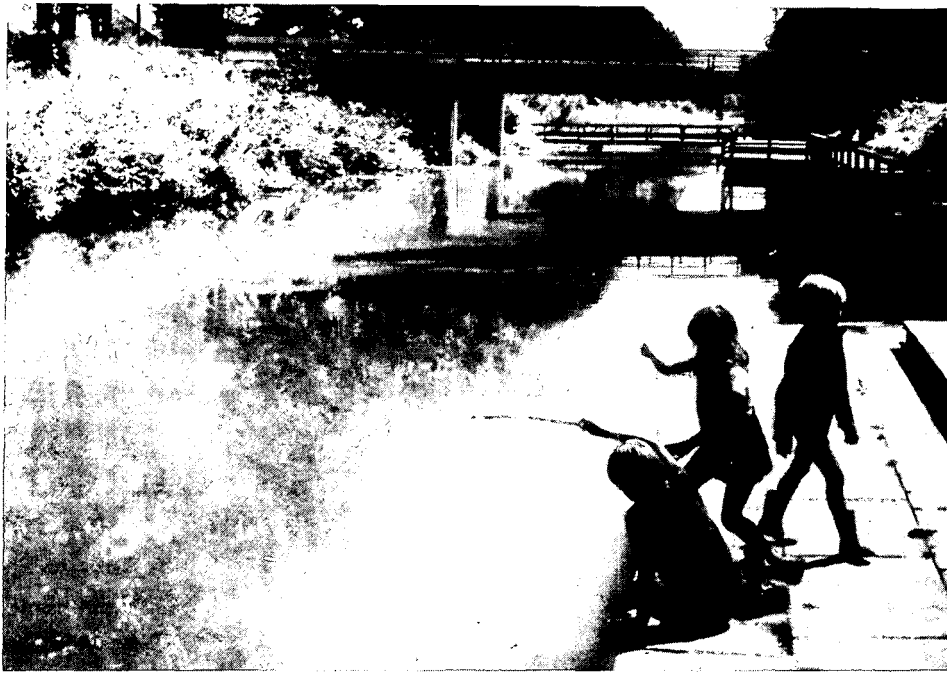
Vissen in het Oranjekanaal in Bargeres (uit 'Bladeren in Emmen')

heeft dan wel haar oorspronkelijke karakter verloren, maar men kan dit nog vinden in de kleine gehuchten als Westenesch en Zuid-barge. Te hopen is dat dit geen steriele enclaves worden met slechts keurig tot woning verbouwde boerderijen, of verkleinde kopie-