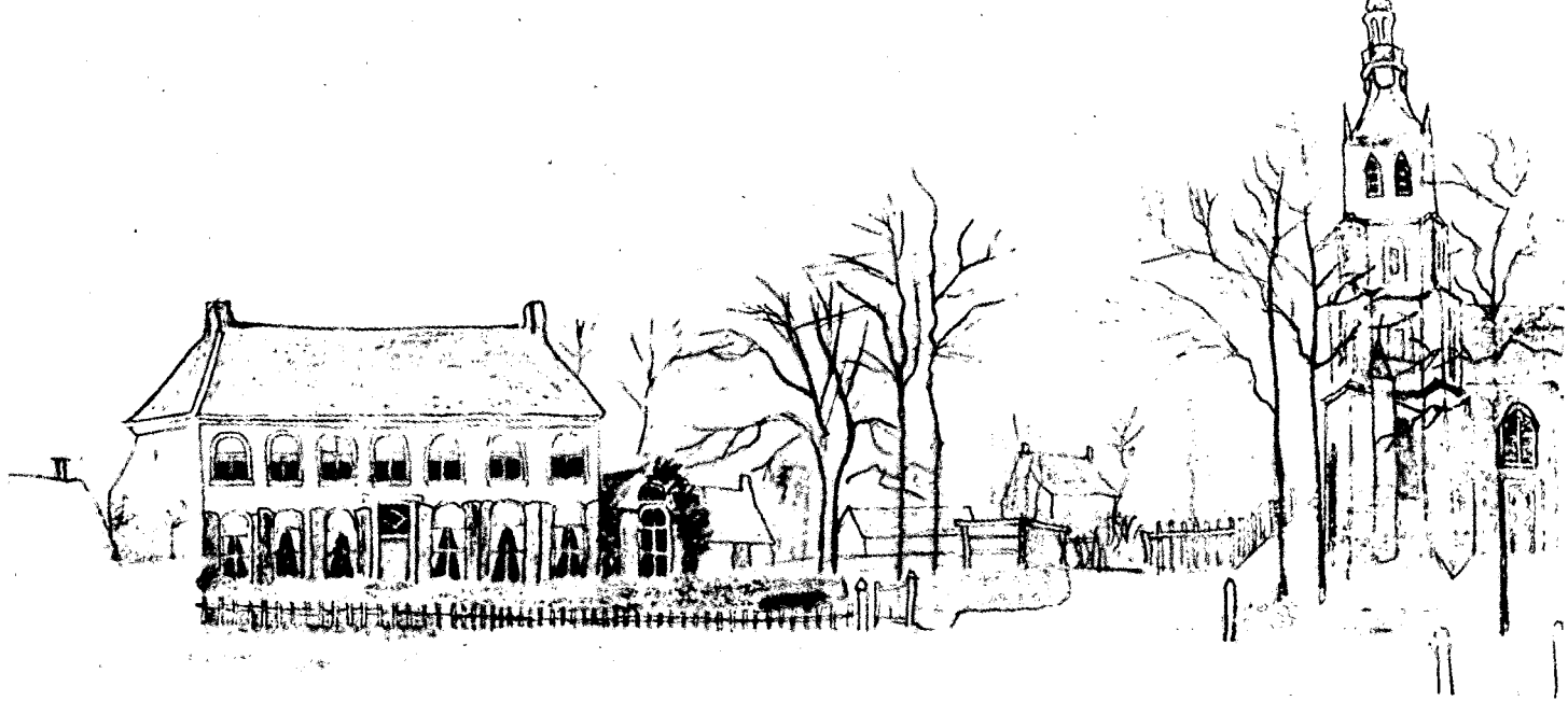
Tekening van de Ettense pastorie en kerk van Vincent van Gogh, gemaakt in 1876.