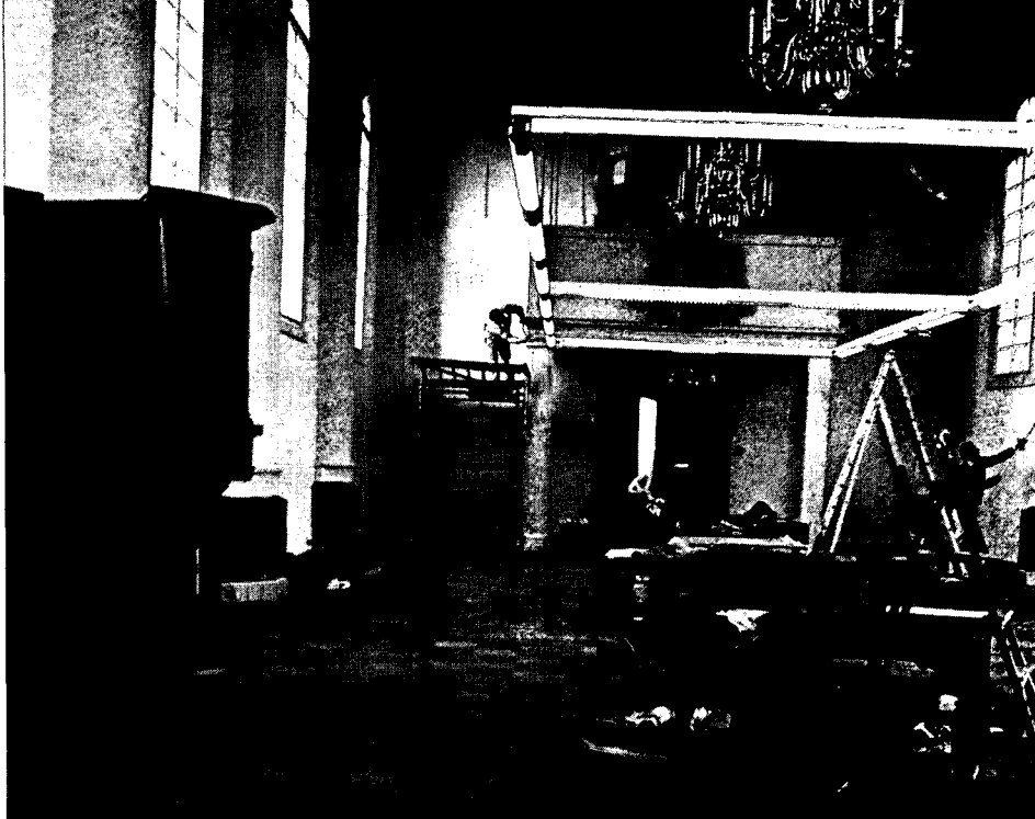
Het interieur van de kerk tijdens de verbouwing.

Toen vervolgens de vraag aan de orde kwam, welke bestemming het gebouw moest krijgen, werd door de gemeente een Activiteitencommissie Nederlandse Hervormde Kerk ingesteld, die met medene-