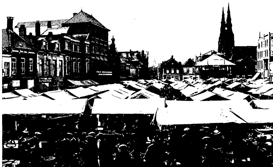
De Markt te Eindhoven op een dinsdagse marktdag in 1928

Die opdracht is niet zonder zin. Zij werd neergeschreven in het jaar waarin Eindhoven haar 750-jarig bestaan vierde. Maar dat jaar was tevens het zoveelste van de periode sinds de grote annexatie van 1920 waarin Eindhoven zich weinig gelegen liet liggen aan de historie binnen haar grenzen. Daarvoor werd de slopershamer te gaarne gehanteerd bij plannen voor de stedebouw. Er zijn gebouwen verdwenen die historisch gezien betekenis hadden. Er is dus weinig meer over.