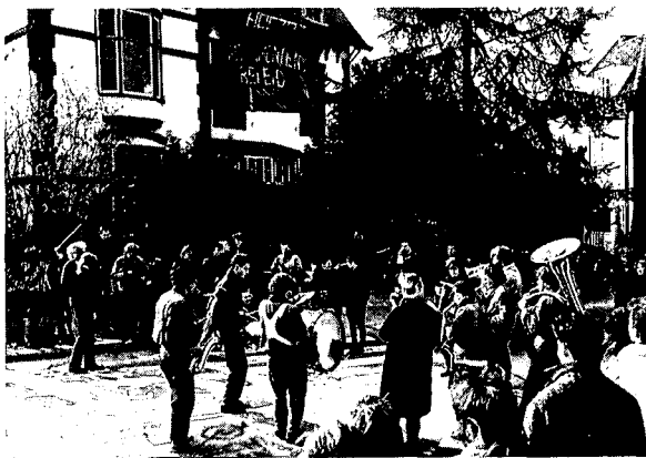
Fanfare d'n Erfenis uit Tilburg zorgde voor de muzikale noot tijdens een demonstratie voor het behoud van Sunny Cottage

Bella ciao, Sunny Cottage, met dit lied hebben krakers en buurtbewoners op 12 maart afscheid genomen van de villa Sunny Cottage in het Wilhelminapark te Breda. Een vaarwel, dat 's morgens begon met de opbouw van een podium, waarop een aantal artiesten optraden. In een tent konden liefhebbers van koffie en erwtensoepp zich komen opwarmen. Automobilisten traptten op hun rem omdat in de anders zo rustige wijk de muziek uit de luidsprekers schalde. Spandoeken werden rondgedragen en de weg rondom het huis afgezet. De dag verliep rustig, buurtbewoners, de zeven krakers en andere betrokkenen gingen tegen het eind van de middag voor een protestmars naar het stadhuis. 's Avonds volgde er nog een feestelijke bijeenkomst in café Para in Breda en dan ligt Sunny Cottage er verder verlaten bij. Alleen de teksten op de aanplakborden vertellen nog het verhaal van deze villa in chaletstijl.