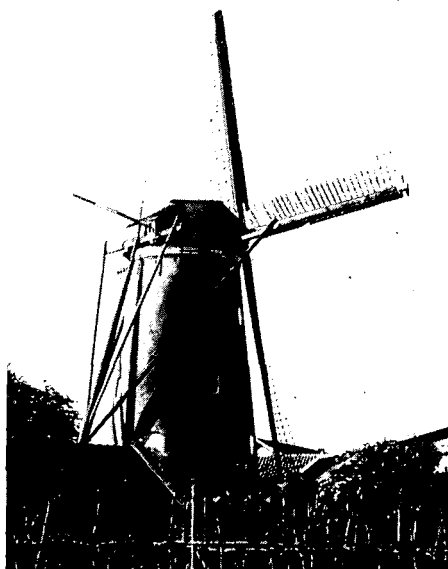
De Maallust in haar oude glorie

Ook de oude bouwvallige Amerongse standerdmolen aan de Achterweg werd in 1830 afgebroken en een hoge, ronde stenen beltmolen kwam ervoor in de plaats, de Maallust. Het is een bovenkruier, dat wil zeggen dat de kap met wieken draait boven de stenen romp en zo naar de wind gezet kan worden. Dat op de wind zetten wordt kruien genoemd. De Maallust is bovendien een beltmolen en die komt in Utrecht weinig voor, meer in het oosten en zuiden van ons land. Een berg- of beltmolen staat op een aarden verhoging om zo-doende meer wind te vangen. Bij de Maallust was dat nodig, omdat de molen dicht tegen de Utrechtse heuvelrug is aangebouwd. F. Stokhuyzen zegt in zijn boek Molens : 'De molen is gewoon op het maai-veld opgericht en wordt meestal tot de eerste zolder (c.3.00 m) aangevuld met een met gras begroeide aarden omwalling. De molenberg die dan is ontstaan, is voorzien van een inrit, met gewelf overkluisd. Soms heeft de berg aan de overkant van de inrit een zelfde constructie als uitrit. Hierdoor kan met paard en wagen worden binnengereden, waarna onder de luiluiken de aangevoerde zakken graan worden opgepikt en men de lege wagen aan de andere kant de berg uitrijdt. (...) Het voordeel van een molenberg is nog dat zij minder onderhoud vergt dan de houten stelling. In de 20e eeuw kwam het wel voor dat de