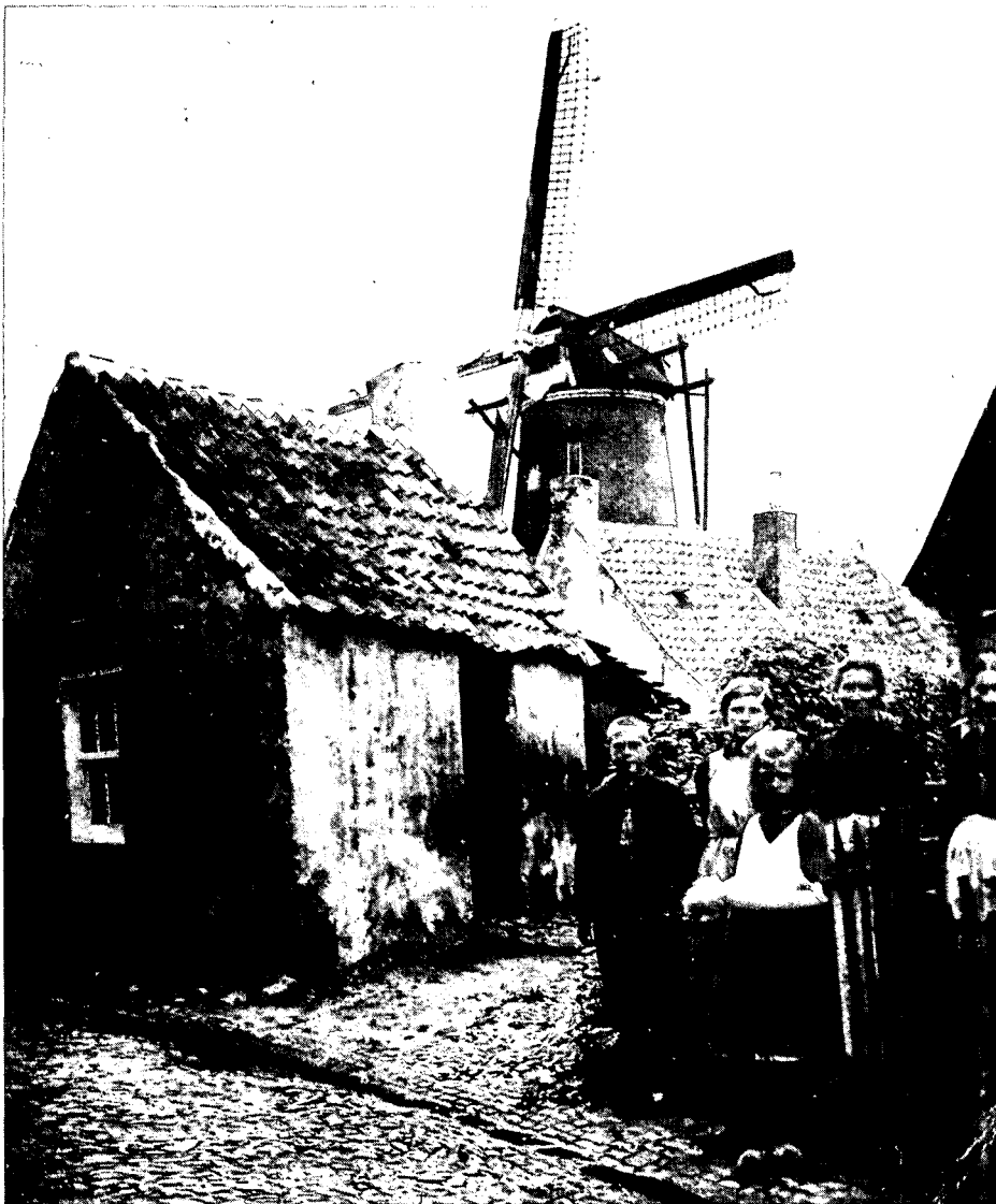
Oude arbeiderswoningen vóór de molen, begin deze eeuw

molenaar door toenemend ruimtegebrek de berg geheel of gedeeltelijk verving door een loods ter hoogte van de berg. Het platte dak werd dan gebruikt om vandaar af de molen te bedienen'.