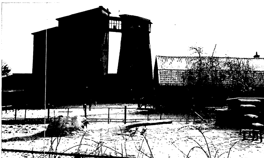
De onthoofde Maallust vormt nu één geheel met twee reusachtige silo's, onderdeel van de voormalige meelfabriek

'De molen weer terug in Amerongen'. Dat staat boven de foto van een markante stenen bovenkruier. De foto dateert uit de jaren '20 en vormt het bovenblad van een folder, uitgegeven door de Stichting 'De Amerongse Molen'. 'De molen weer terug in Amerongen' is dan ook geen mededeling, maar een oproep, een cri de coeur.