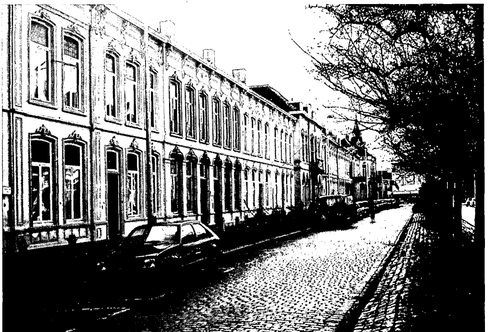
Blok van 16 witgepleisterde panden met paleisachtige opzet: uitspringende middenrisaliet en 'hoekpaviljoens'. Belangrijk voorbeeld van negentiende-eeuwse stadsuitleg. Stationsstraat, gebouwd 1879.