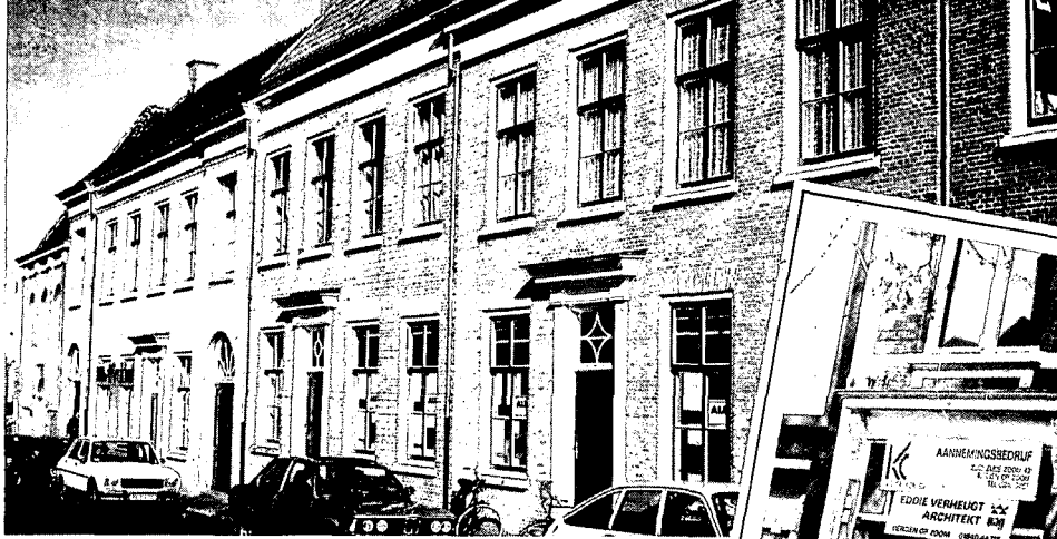
'Architectuur als theaterdecor', Koevoetstraat

niet meer te verwijderen is zonder de steen te beschadigen.