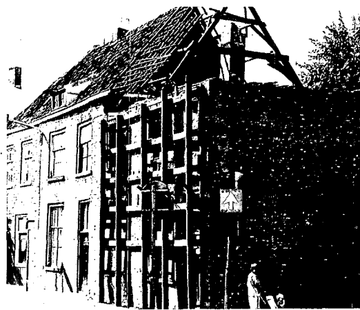
Blauwehandstraat na de restauratie in 1982.

Blauwehandstraat (1980), huis met een middeleeuwse kern (na 1502) en een nog oudere achtergevel uit kloostermoppen (± 1400). Dit wellicht oudste woonhuis van de stad met zestiende-eeuwse eiken kap en moer- en kinderbalklagen, fraaie sleutelstukken en kraagstenen, moest voor de Raad van State gered worden van sloop.