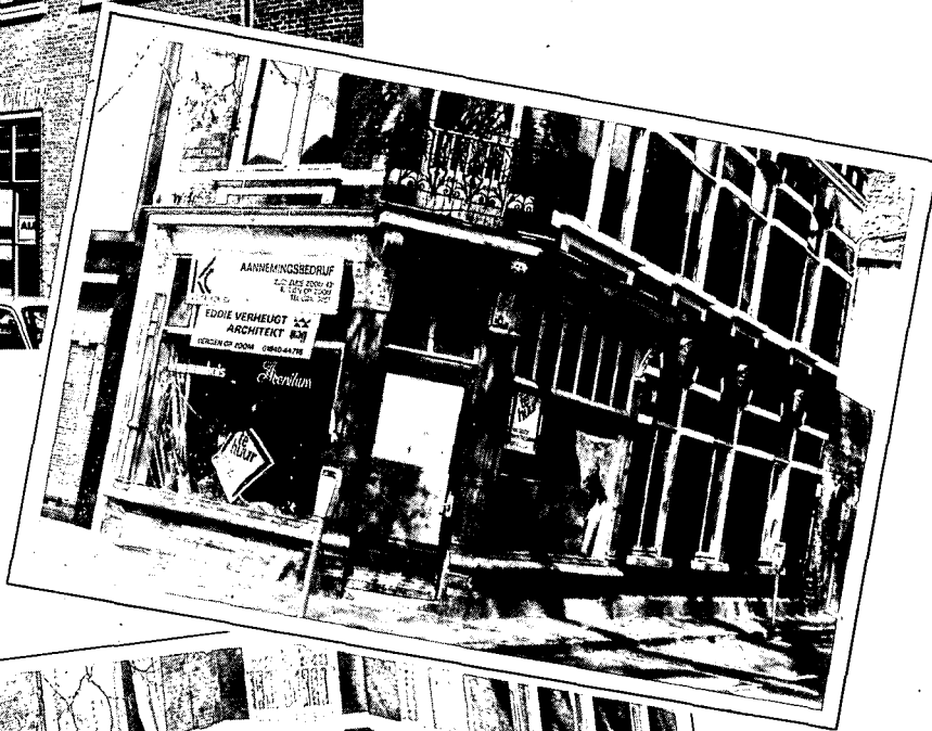
Zuivelstraat, winkelpui uit de bouwtijd van het huis (1905, C. P. van Genk). Toestand 1981.