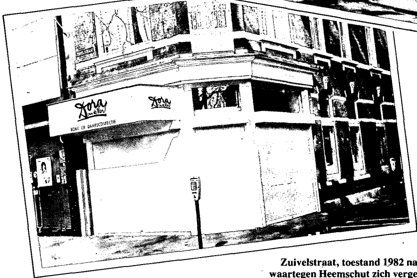
Zuivelstraat, toestand 1982 na de verbouwing waartegen Heemschut zich vergeefs verzette. De vervanging van deze karakteristieke winkelpui, waarbij ook het aardig gedetailleerde balkonhekje verdween, betekent een grote verarming van deze straathoek.