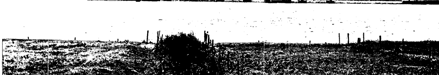
Overzicht Nijmeegse benedenstad.

V.l.n.r. Stratennakerstoren, Valkhof, Romeinse muur, Besiendershuis, Raadhuistoren en Brouwershuis.