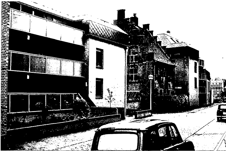
Disharmonie van oud en nieuw aan de nieuwe Vleeshouwerstraat.

alswel aan het onbenul van degenen, die het 'wurgkontraakt' met het casino opstelden en ondertekenden. Er is dan ook geen sprake van winnaars of verliezers in de strijd om het behoud van de Romeinse muur. Er zijn alléén verliezers. Daaraan kunnen ook de vijf meter muur en de resten van een ter plaatste eveneens gevonden hypocaustum of Romeinse vloerverwarming, die straks als meubelstukken ergens in het casinogebouw een plaats zullen krijgen, niets afdoen.