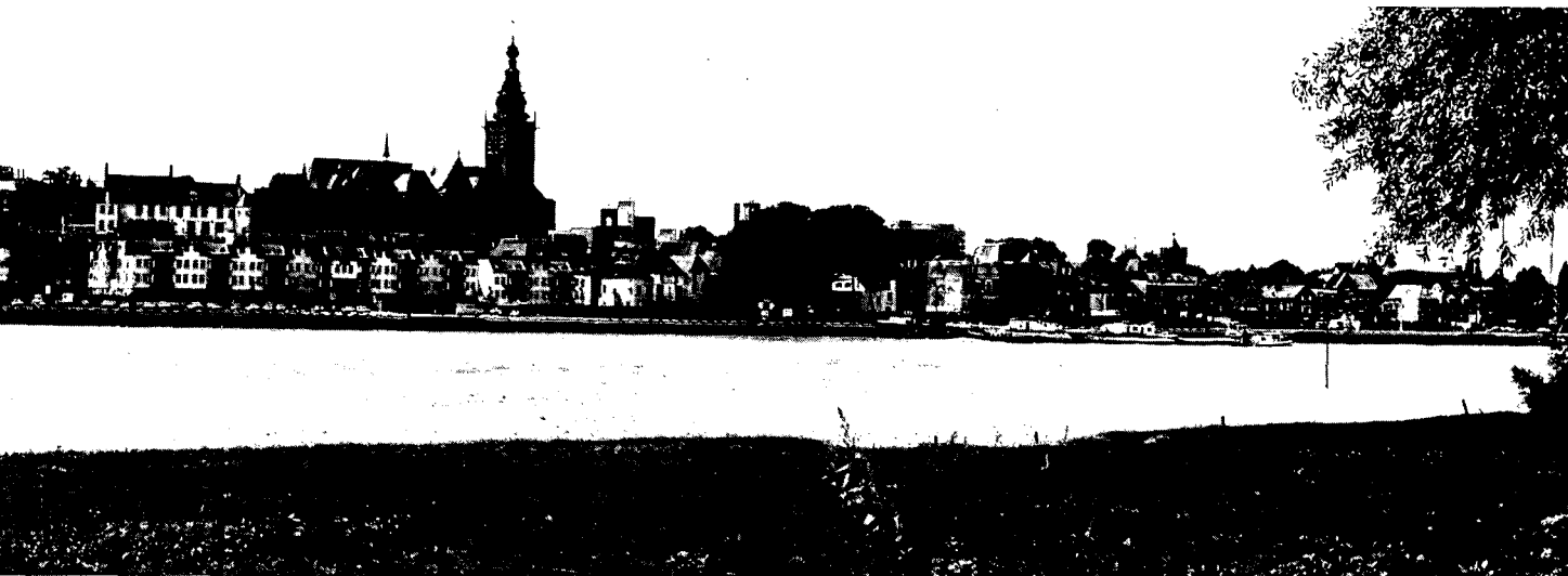
V.l.n.r. Uitbreiding Commanderie, Sint Stevenskerk, Sint-Anthoniuspoort en Oude Haven.

den, blijkt uit de vergelijking van de produkten van twee ontwerpers. Zo hebben de woonhuizen in het westelijk deel van de benedenstad meer weg van nauwelijks vermomde woningwetwoningen, zoals men ze in iedere nieuwbouwwijk in Nederland kan aantreffen, dan dat ze trachten het lang vergeten type van het stadswoonhuis opnieuw te interpreteren. Dat laatste kan duidelijk gezegd worden van de nieuwe bebouwing in het midden- en oostelijk deel van de benedenstad, waarbij het experiment met vorm, materiaal en kleur minder geschuwd is.