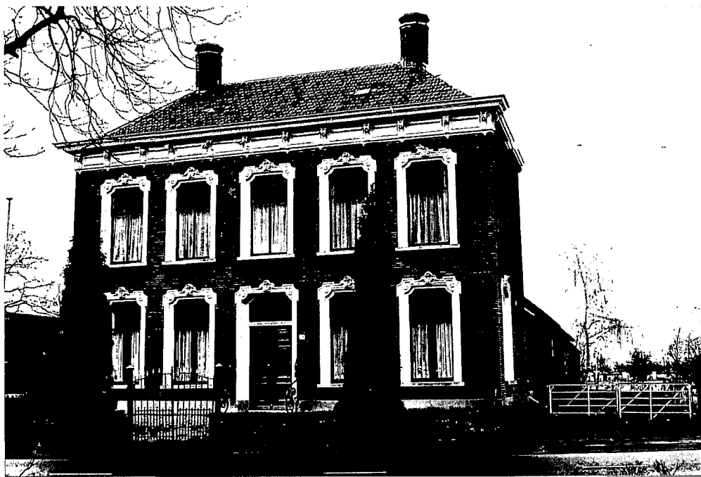
Monumentaal herenhuis aan Julianalaan 15.

De monumentenzorg is een integraal deel van de overheidszorg voor de gebouwde omgeving in het belang van de burger. Bij het inhoud geven aan die monumentenzorg zal het monument daarom niet los mogen worden gezien van de directe omgeving. Daarnaast dient de burger nauw te worden betrokken bij de zorg voor het monument. Onder meer is een goede informatie naar de burger beslist noodzakelijk. Een verhaal uit de praktijk over de aanpak van de monumentenzorg in Sprang-Capelle.