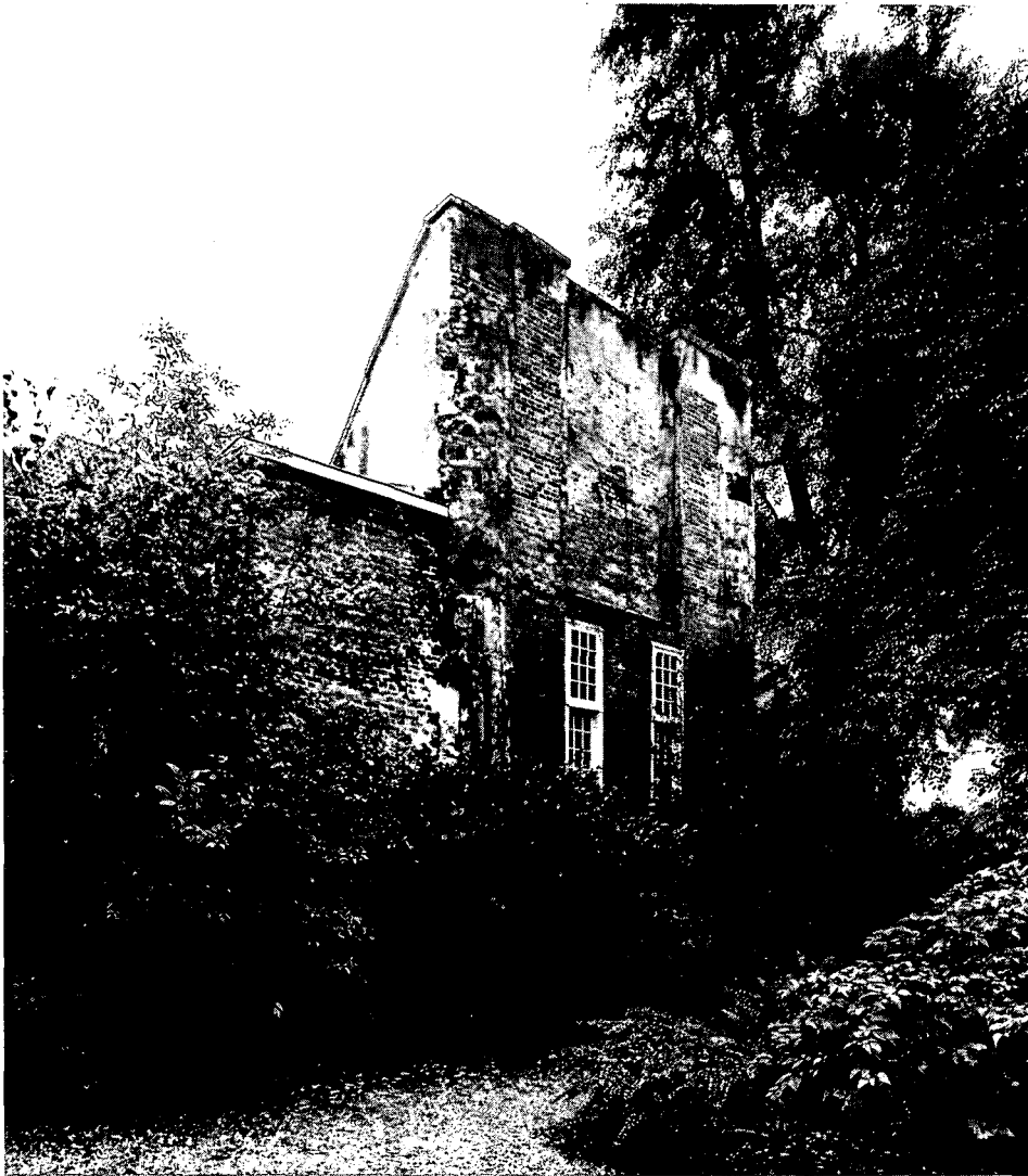
Het Duitse Huis; de Mariakapel, die waarschijnlijk dateert uit het begin van de 15 e eeuw. De kapel stond aan de zuidzijde tegen de kerk die in 1674 instortte.

peliers. Rond 1300 raakte de orde de bezittingen in het Heilige Land door toedoen van de islamieten zelfs geheel kwijt. Inmiddels had de orde zich in Europa gevestigd, met name in het kustgebied aan de oost- en zuid-oostzijde van de Oostzee, in het huidige Polen en Rusland. Daar was zij sedert 1230 behulpzaam geweest bij de kerstening van de bevolking, die de zon, de maan, de sterren, de donder, vogels, slangen en kikvoren en dergelijke aanbaden.