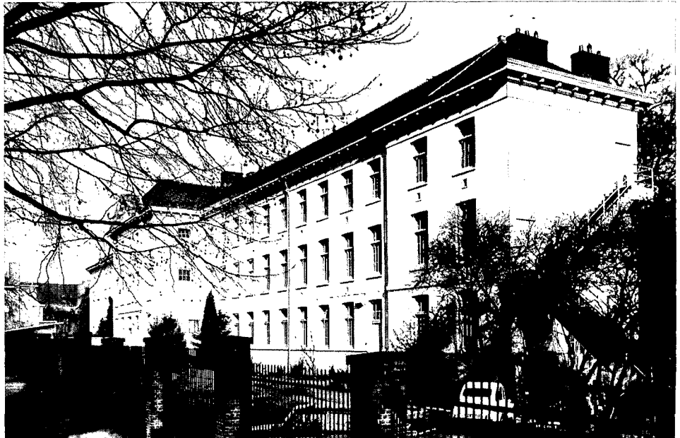
Het Duitse Huis; het monumentale 'beddengebouw' aan het Geertebolwerk. Het gebouw kwam in twee fasen tussen 1823 en 1831 tot stand en bood plaats aan ca. 400 zieken.

In 1822 werden de hospitalen van onderwijs te Leiden en te Leuven opgeheven. Als gevolg daarvan werd in hun plaats één Rijkswaarschouder voor militair geneeskundigen aan het hospitaal te Utrecht verbonden, wat in de loop van de jaren belangrijke bouwactiviteiten met zich mee bracht. Met gunstig