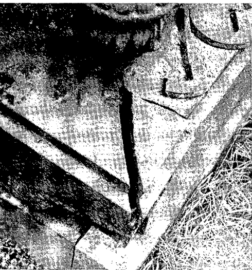
Detail van het grafmonument te Breda, de basis is gebarsten.

ten van onze 19e-eeuwse gietijzerijen. Naast de van oudsher gebruikte natuursteen, betekende de introductie van het gegoten ijzer een nieuw element in het materiaalgebruik voor graftekens. Ze maakten deel uit van de vaste collectie die de gieterijen voerden. Een omstreeks 1830 uitgegeven catalogus van de ijzergieterij Nering Bögel te Deventer biedt een gevarieerd beeld van wat er zoal op dit gebied door de fabriek geleverd kon worden. De aanduiding 'gieterij Deventer' is nog op veel monumenten te herkennen. Naast de firma Nering Bögel waren er natuurlijk nog andere gieterijen, die dergelijk produkten leverden. Helaas zijn de catalogi van ijzergieterijen zeldzaam geworden boekwerken. De tweede helft van de eeuw heeft ons wat dit betreft méér nagelaten. Hoewel lang niet alle gieterijen 'grote monumenten' in hun catalogi opnamen, leverden zij vrijwel alle zgn. grafattributen als vlieders, staartbijtende slangen, doodshoofden met knekels, vliegende zandlopers etc. Allemaal