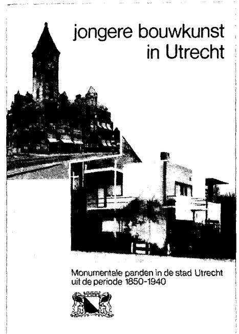
1. Omslag van het boekje dat een inventarisatie van de Jongere bouwkunst in de stad Utrecht uit de periode 1850-1940 bevat.