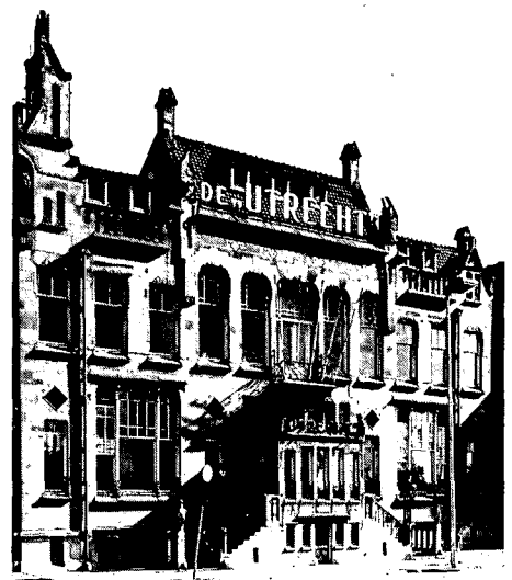
2. Gebouw van de verzekeringsmaatschappij 'De Utrecht' aan het Leidse Veer. Gesloopt in 1974.

De Utrechtse inventarisatie is voorbereid door de onderafdeling Monumenten van de Dienst Bouwen en Wonen van de gemeente Utrecht. Vijf, in gemeentediens werksame deskundigen hebben een foto-inventarisatie van de jongere monumenten gemaakt. Deze inventarisatie, die in de loop van de beoordeling werd aangevuld, besloeg uiteindelijk een 700-tal panden.