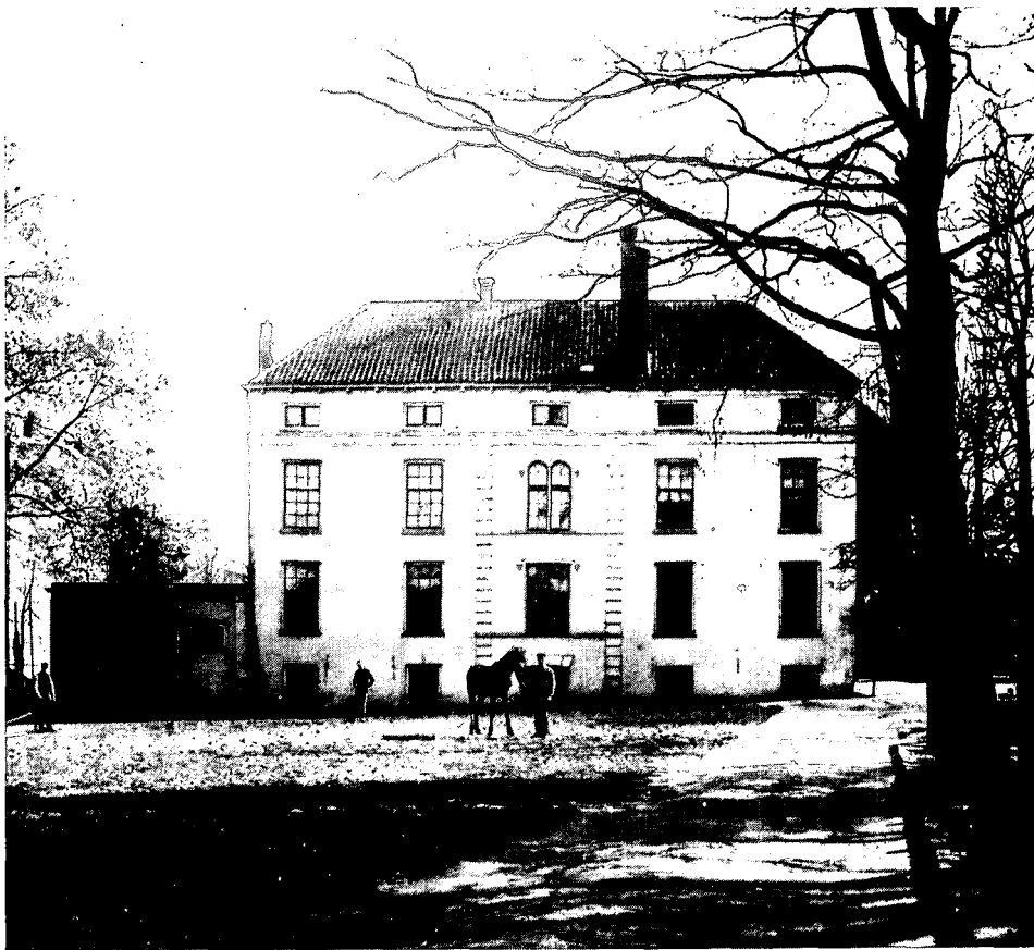
2. De achterzijde van de oude katoenfabriek van Pöttnner en Quincke rond 1890, met links de lage aanbouw uit 1872, die tot 1921 dienst heeft gedaan voor de lessen in anatomie.

De bebouwing van de voormalige Rijksveeartsenijschool (afb. 1) is vrijwel geheel gelegen op een langgerekt stuk terrein aan de oostzijde van Utrecht. Dit gebied wordt omsloten door de Biltstraat, Biltse Grift, Krijtstraat en de Bollenhofsestraat. Het complex is geleidelijk gegroeid in de periode tussen 1821 en 1924 en bezit door de veelal voor een specifieke functie ontworpen opzet en door de verscheidenheid aan bouwstijlen van de verschillende gebouwen een uniek karakter.