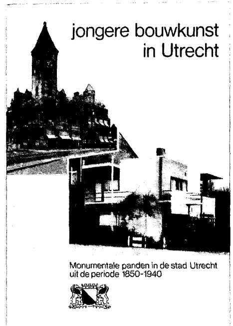
1. Omslag van het boekje dat een inventarisatie van de Jongere bouwkunst in de stad Utrecht uit de periode 1850-1940 bevat.