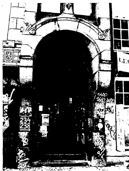
Recente foto van de ingang aan de Nieuwezijds Voorburgwal

Als we het gebouw van het Algemeen Handelsblad eens nader gaan bekijken,