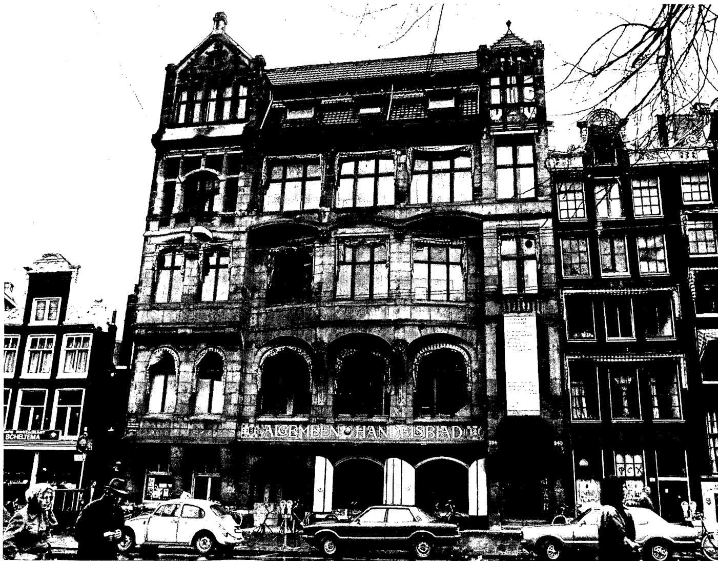
Voorgevel Handelsbladgebouw