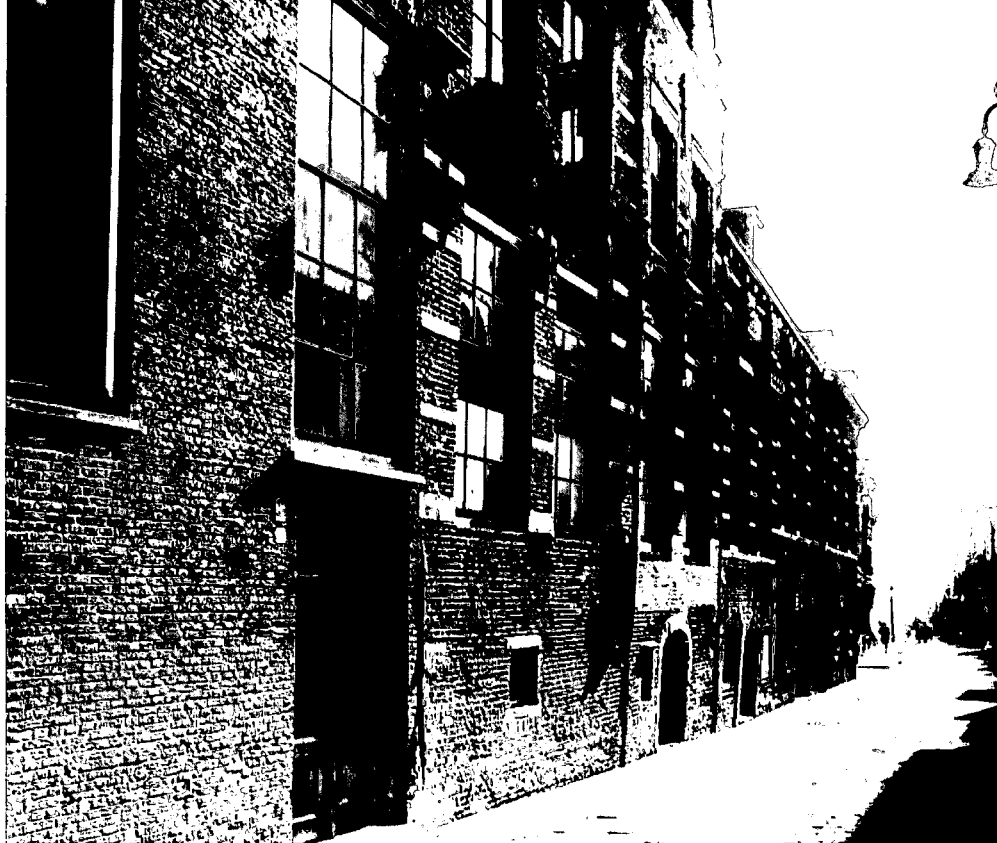
Nieuwstraat met gebouw 'De Berckepoort' voor de recente verbouwing.