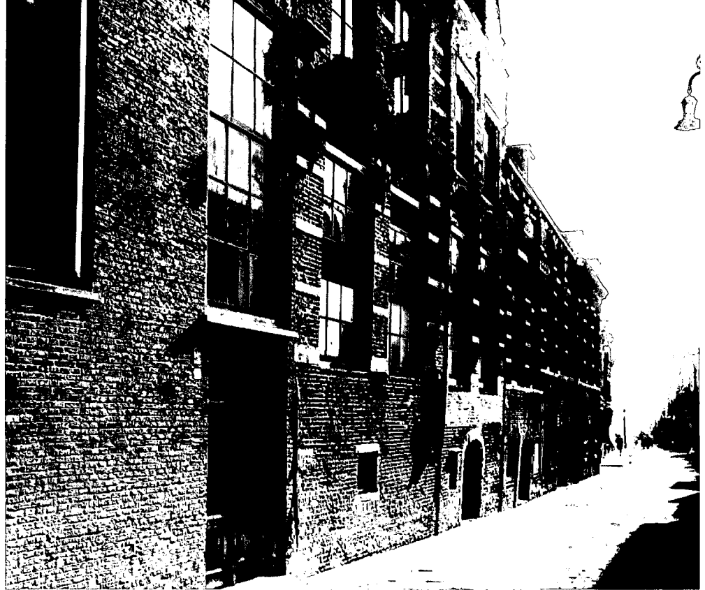
Nieuwstraat met gebouw 'De Berckepoort' voor de recente verbouwing.