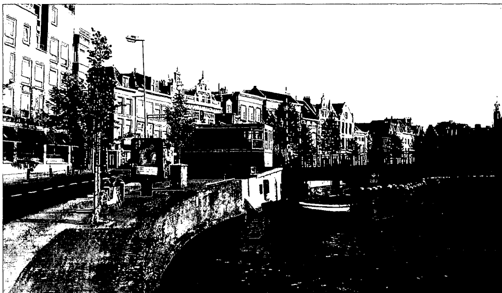
Onhandig geplaatst straatmeubilair: een brugwachtershuisje ter hoogte van de Korte Veerstraat.

Hoewel de meeste Haarlemmers nog in bed liggen is het op deze zomerse zondagochtend op het Spaarne, ter hoogte van de Turfmarkt, al een drukte van belang. Plezierboten van allerlei formaat liggen te wachten op het moment dat de brug open gaat. De meeste opvarenden ondergaan deze verplichte wachttijd gelaten en hebben zich met een mok koffie op de voorplecht genesteld om te genieten van de warme ochtendzon.