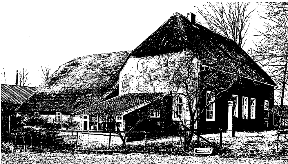
De boerderij op het voorplein van Den Engh uit 1630, en verbouwd in 1910.

In feite is dan ook niemand echt tevreden: de monumentenfreaks niet, omdat het monument fundamenteel is aangetast en de nieuwe gebrui-