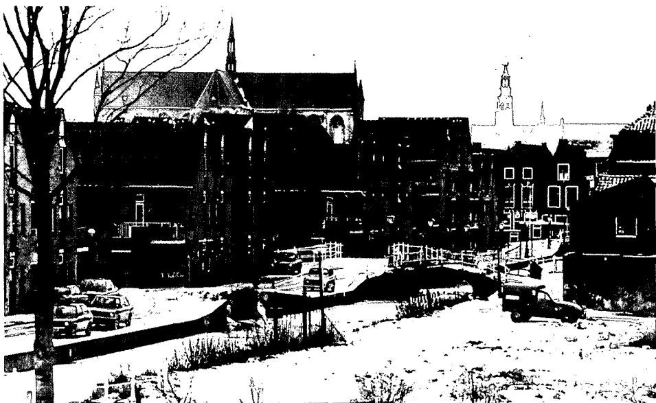
nieuwbouwwoningen in het voormalige saneringsgebied Herengracht-Zijlsingel (zone C van het beschermd stadsgezicht).

Leiden is een van de weinige steden in Nederland, waar men in de vorige eeuw een eigen model gietijzeren lantaarnpaal liet maken, die nog steeds bijgegoten kan worden.