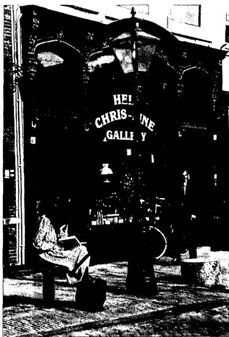
aankleding van het openbaar gebied met de Leidse Paal voor een laat negentiende eeuwse winkelpui.

In 1979 werd voor 85 panden (inclusief de hofjeswoningen) subsidie aangevraagd en in 1980 75.