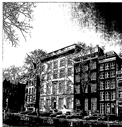
Het derde huis links vanaf de Raadhuisstraat, links op de foto, is het magnifieke Herengracht 180, gebouwd in 1759.

Er mag dan een Herengracht zijn in Leiden, in Maarsen, in Hasselt, in Muiden en zelfs in het Zuid-Afrikaanse Kaapstad, de enige echte Herengracht bevindt zich toch in Amsterdam. De 2,4 kilometer lange Herengracht – genoemd naar de Heren Regeerders van de stadsstaat – is in drie fasen aangelegd.