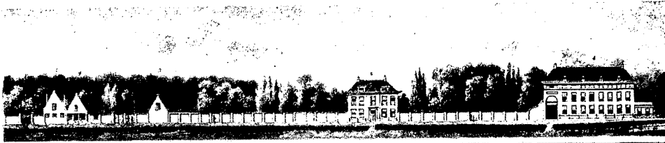
3. De gebouwen van de Veeartsenijschool zoals die na de opening in 1821 gereed waren gekomen. Boven: een gezicht vanaf de Biltstraat. Rechts: een gezicht vanaf de overzijde van de Biltse Grift. Litho van C. Oosterman uit 1836.

sober uiterlijk in de in die tijd gebruikelijke classicistische vormtaal. Het is een vroeg en merkwaardig voorbeeld van een bedrijfsmonument, dat eerder doet denken aan een buitenplaats, opgezet door een rijke burger om buiten de stad te kunnen vertoeven dan aan een gebouw voor bedrijfsmatige doeleinden. Het geheel bezit een voor fabrieksgebouwen conventionele opzet met houten balklagen voor de vloeren en een indrukwekkende samengestelde houten kapconstructie.