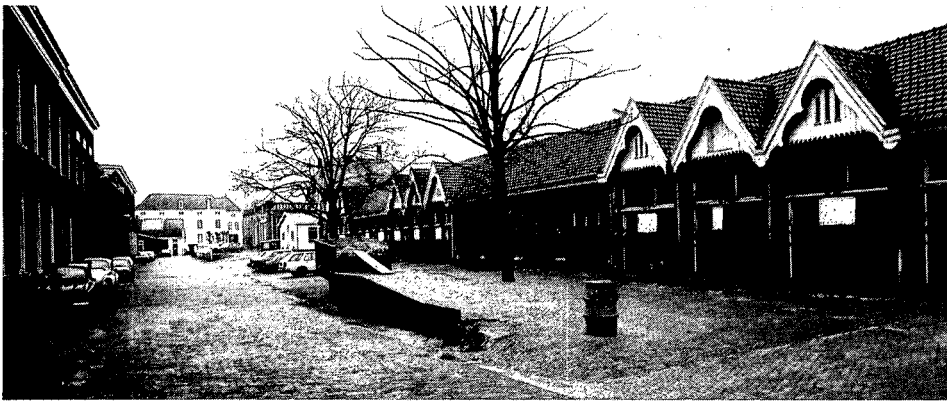
6. Links de oude stallen uit 1875 en rechts de nieuwe stallen gebouwd in twee fasen in 1905 en 1912. Op de achtergrond het Poortgebouw.

Het eerste en tevens één der fraaiste gebouwen van deze nieuwe bouwphase is de door C. H. Peeters ontworpen manege uit 1905 (afb. 5) tussen de stallen en het schoolge-