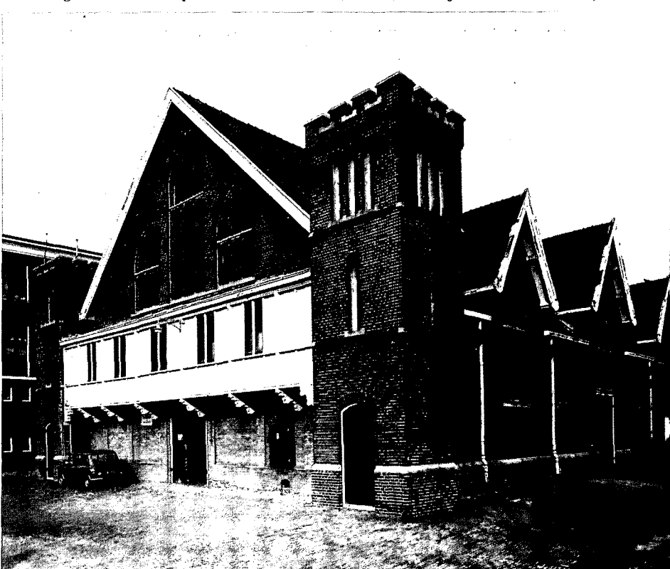
5. Manege uit 1905 ontworpen door C. H. Peeters.

Rond 1900 begonnen veranderingen binnen de structuur van de school op te treden. Het internaat werd opgeheven, waardoor meer ruimte voor het geven van onderwijs beschikbaar kwam. Ook bestonden er toen plannen om het instituut te verheffen tot Hogeschool (iets wat pas in 1918 daadwerkelijk zou gebeuren). Een middel om dit hogere niveau te bereiken was de bestaande onderzoeksmethoden te moderniseren o.a. door het bouwen van nieuwe moderne laboratoria. Vanaf 1905 tot 1916 werd door de Rijksbouwmeester een groot aantal gebou-