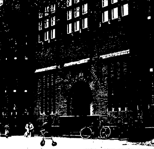
7. Voorgevel van het Veterinair Anatomisch Instituut uit 1921. Een ontwerp in Amsterdamse School van de architect J. Crouwel.

een woonbestemming aan te geven. De gemeente Utrecht, die het terrein van de Universiteit had overgenomen, liet in 1983 in samenwerking met de namens de buurt optredende architectenbureaus Anke Colijn en De Kleine Stad een haalbaarheidsonderzoek uitvoeren. Uit dit onderzoek is gebleken dat verbouwing tot woningen of andere herbestemming in principe tot de mogelijkheden behoorde. Een tweede onderzoek gaf aan dat het merendeel van de bebouwing voor aanpassing tot woning geschikt is. Alleen het sektegebouw, de manege, de hondestal en het Veterinair Anatomisch Instituut zijn door hun opzet niet geschikt voor woonruimte en zullen een andere passende bestemming krijgen.