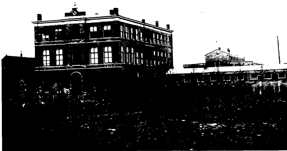
4. Het onderwijsgebouw uit 1876 in haar oorspronkelijke toestand. In 1912 is het gebouw aan de linkerzijde met een travee uitgebreid. Foto ca. 1890.

Toen in 1821 de Rijks Veeartsenijschool werd geopend, waren Gildestein en het fabrieksgebouw (bekend onder de naam 'Poortgebouw') de belangrijkste behuizingen van de school (afb. 3). Het voormalige landhuis werd in gebruik genomen als directeurswoning (wat het tot 1909 zou blijven) en de fabriek werd ingericht voor het onderwijs en voor de huisvesting van de leerlingen, die aanvankelijk verplicht waren intern bij de school te verblijven.