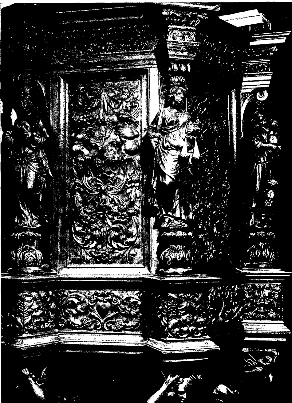
Details van de fraai gesneden preekstoel met evangelistensymbolen en allegorische vrouwenfiguren uit 1711.