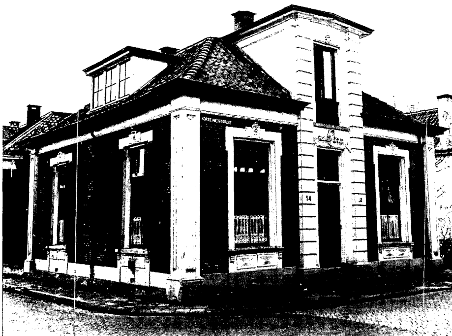
Een van de Apeldoornse huuskes aan de Korte Nieuwstraat, die als geheel op de monumentenlijst staan

Toch is ook in Apeldoorn een toenemende belangstelling voor monumentenzorg te constateren. Sinds 1977 is er bijvoorbeeld een gemeentelijke monumentencommissie. De eerste aarzelen hiertoe en tot het maken van een gemeentelijke monumentenverordening kwamen voort uit de bevolking en de gemeenteraad. Met ingang van 1985 is tevens een gemeentelijke subsidieverordening van kracht. In die zin is het monumentenbeleid veelbelovend en geloofwaardig gestart.