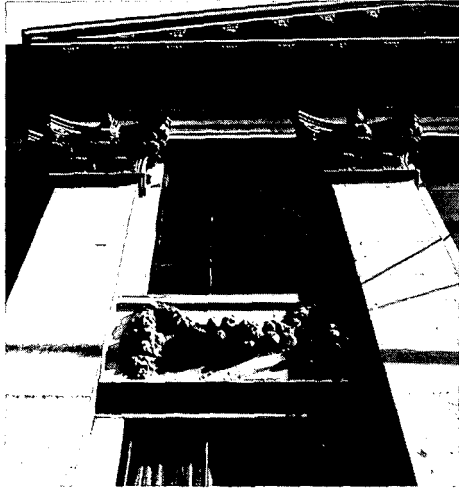
Detail van het zg. Poppen-huis aan de Kloveniersburgwal 95 naar ontwerp van Vingbooms uit 1642.

Van 5 juni tot 19 september biedt het Allard Pierson Museum te Amsterdam onderdak aan de tentoonstelling 'Hoe klassiek is Amsterdam'. Deze is samengesteld door 18 studenten in de kunstgeschiedenis en archeologie aan de Universiteit van Amsterdam, die hiermee een bijdrage leveren aan de viering van het 350-jarig bestaan van deze Universiteit.