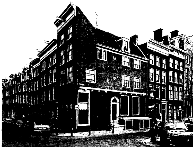
De Herenstraat, een sterk in verval geraakte radiaal-winkelstraat, kwam weer tot bloei na de restauratie van een groot aantal panden door Stadsherstel.

aan de stichting, hetgeen het voordeel heeft, dat de eigenaar met één instantie te maken zou krijgen en dat er één subsidie gegeven werd.