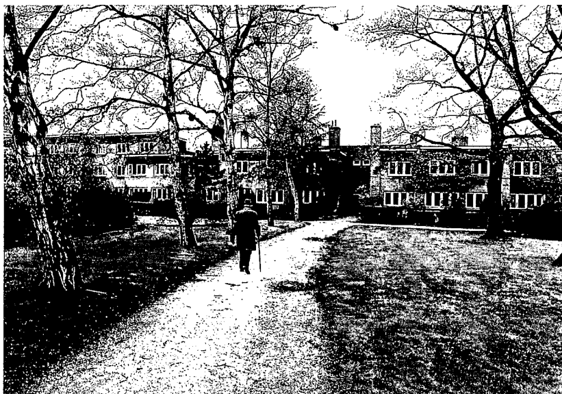
Binnentuin in de Tuinwijk

Zover is het niet gekomen, de idealen van Van Loghem en met hem nog vele andere architecten en stedsbouwers ten spijt. Wel is ons land in de periode vanaf ongeveer 1910 tot in de