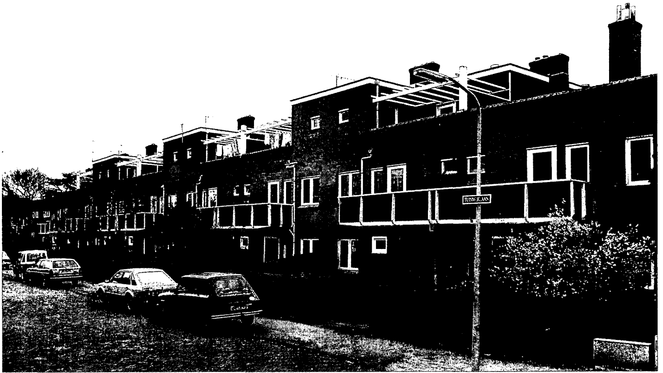
Huizen van Van Loghem aan de Tuinwijklaan