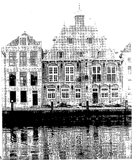
1 DE VOORGEVEL VAN HET GEMEENLANDSHUIS TE MAASSLUIS. J. KÜHN, 1979 COLL. HOOGHEEMRAADSCHAP DELFLAND