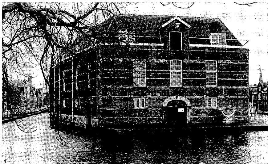
1 HET ARSENAAL IN DELFT (BEGIN 17E EEUW), DAT THANS EEN DEEL VAN HET LEGER- EN WAPENMUSEUM HERBERGT

Vanaf de jaren vijftig tot heden toe zijn de collecties nieuwe resp. moderne wapens, voertuigen, verbindingsmiddelen, geschut, tanks, raketten enz. verenigd onder de naam 'studiecollectie Militair Materieel', een afdeling van het Koninklijk Nederlands Leger- en Wapenmuseum, opgesteld resp. opgeslagen in het uit drie gedeelten bestaande gebouw, de voormalige 's Lands Magazijnen', aan de Korte Geer. De toestand van het in beheer bij het Ministerie van Defensie zijnde rijkseigendom is van dien aard dat regen en sneeuw hoe langer hoe meer vrij spel krijgen. Daardoor moeten de collecties, waaronder een zeer kostbare bibliotheek van 250.000 delen, met plastic zeilen zo goed mogelijk worden beschermd tegen permanent geworden lekkages, die