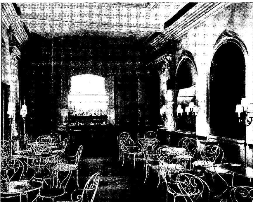
Interieur van de manege

De Hollandse Manege is decennia lang de plaats geweest waar de Amsterdamse goeude burgers (en leden van het Koninklijk Huis) op stijlvolle, haast ceremoniële wijze de rijkunst beoefenden en gepaste ontspanning zochten. Vaste gebruikers waren o.m. „de Officieren-Rijclub”, de „Amsterdamse Rij-Sociëteit” en de „Amsterdamse studentenrijclub H.O.R.S.”. De gewone man kwam er niet aan te pas, maar van die exclusiviteit is thans niets meer over. Het niveau van de lessen is hoog gebleven, maar er wordt nu door mensen uit alle lagen van de bevolking van de manege gebruik ge-