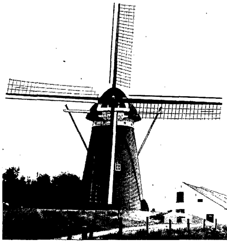
Na 60 jaar zitten er weer wieken aan de Düffels-Möll. Rechts: het uit 1870 daterende muldershuis.