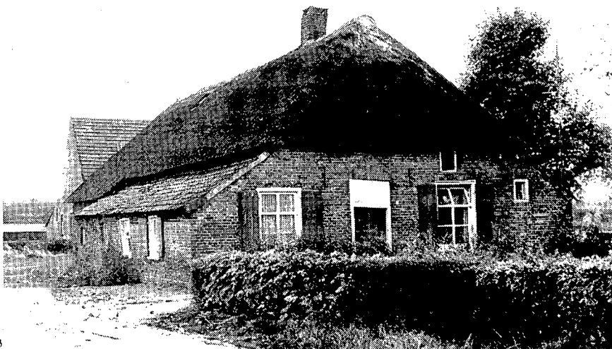
3 BOERDERIJ NABBEGAT 11 (BESCHERMD).