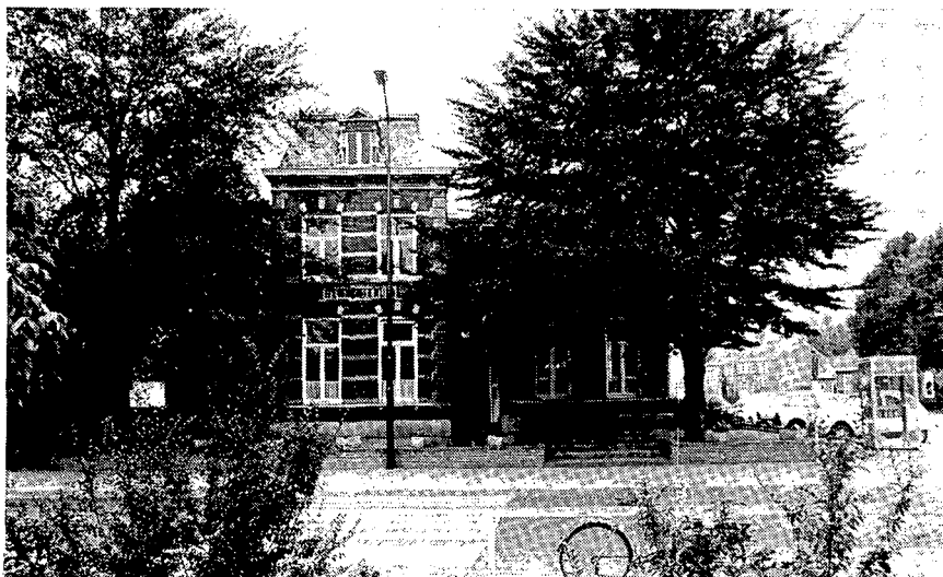
1 HET GEMEENTEHUIS VAN ZEELAND (N.BR.), DAT VOOR SLOOP IS BESTEMD

penweg, die van Eindhoven naar Ravenstein voert en daar aansluiting geeft op de rijksverkeersweg. Om het nog een beetje te verduidelijken: Zeeland ligt ten noorden van het Vliegveld Welschap en zuidwestelijk van Grave.