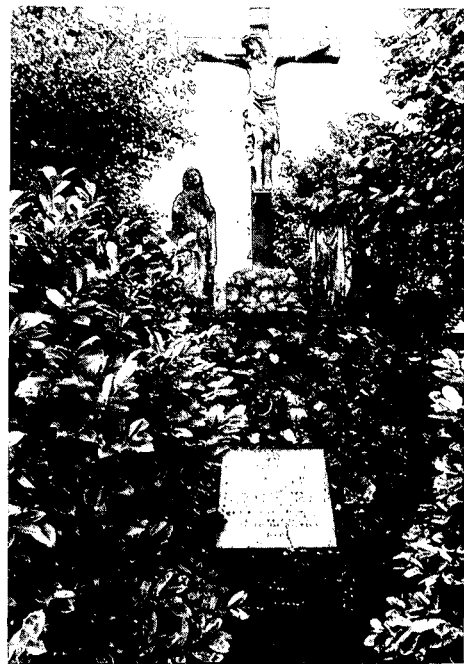
Religieus monument aan de Nieuwstraat te St. Michielsgestel.