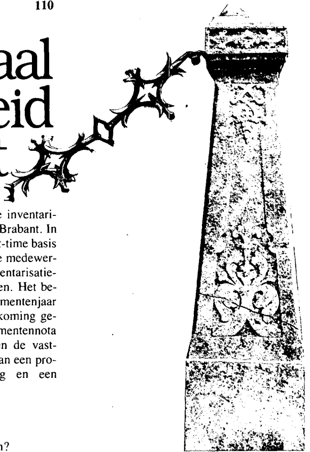
Straatmeubilair aan de Stationsstraat te Boxtel.