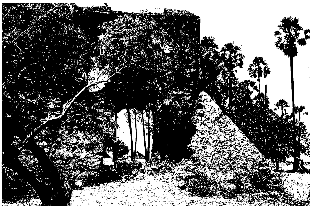
Resten VOC-fort op het eiland Delft, Sri Lanka.