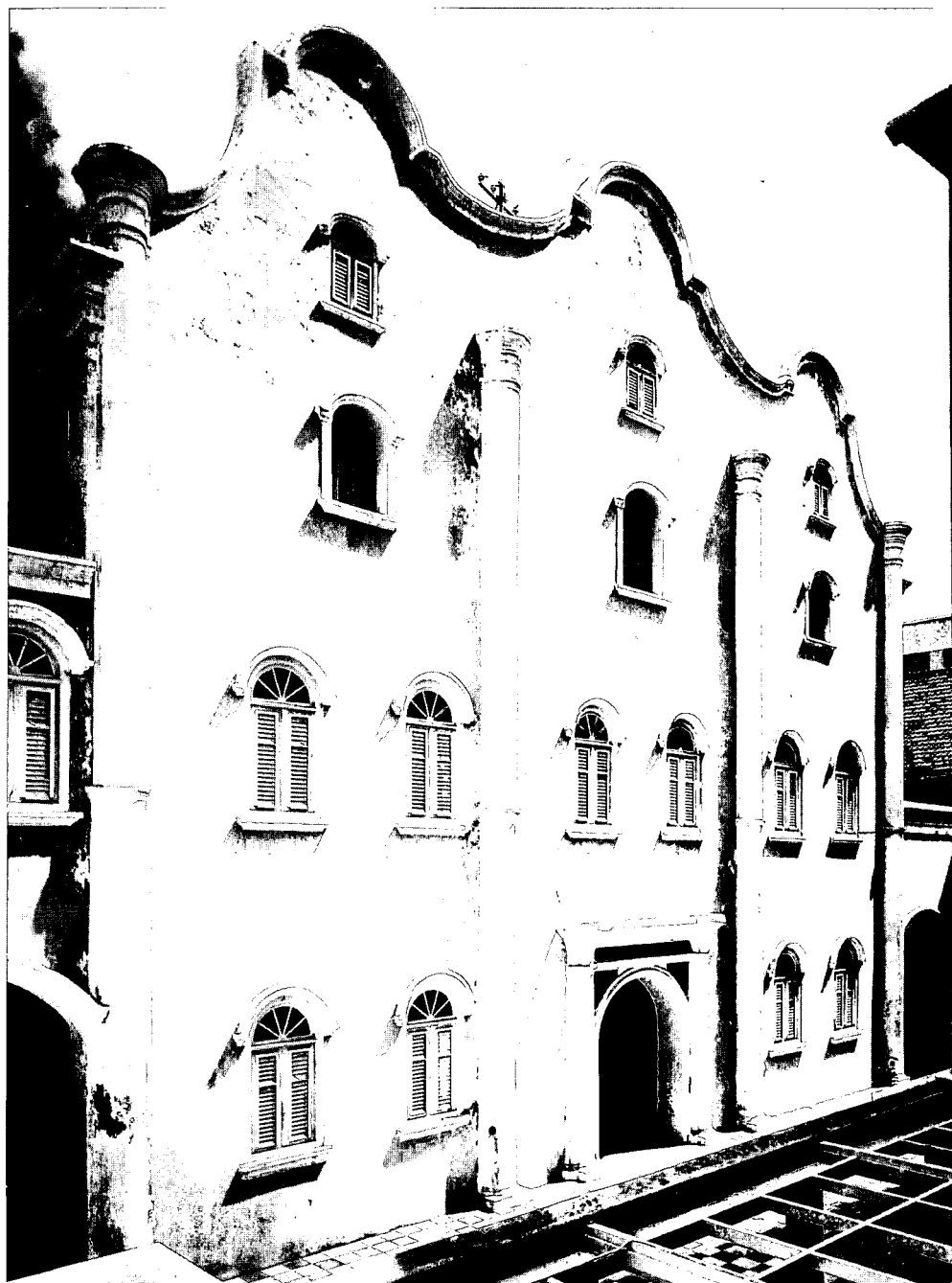
Synagoge Punda in Willemstad, Curaçao, gevel met binnenplein.

'Om meerdere redenen is die bemoeienis terecht. Ten eerste omdat het gemeenschappelijk cultureel erfgoed een belangrijk deel vormt van de Nederlandse geschiedenis. Zonder Oost- en West-Indische Compagnie had ons eigen gebouwde verleden er heel anders uitgezien. Vele van onze huidige monumenten konden gebouwd worden door de enorm sterke positie die we in de handel hadden. Ook in de periode na het herstel van het koninkrijk in 1813 werden allerlei infrastructurele werken, zoals de Hollandse waterlinie en de Stelling van Amsterdam gefinancierd uit de ontwikkeling