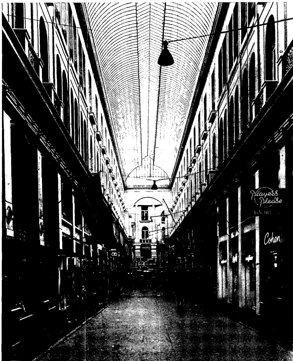
De Passage (tussen 1883 en 1885, ontwerp H. Westra jr.), een met gietijzer en glas overdekte winkelstraat. Deze is het laatste overgebleven voorbeeld in Nederland van de winkelpassages die in de tweede helft van de 19de eeuw in de grote Nederlandse steden werden gebouwd.

bied Prinsegracht-Laan-Westende en een deel van de binnenstad richting Noordeinde.