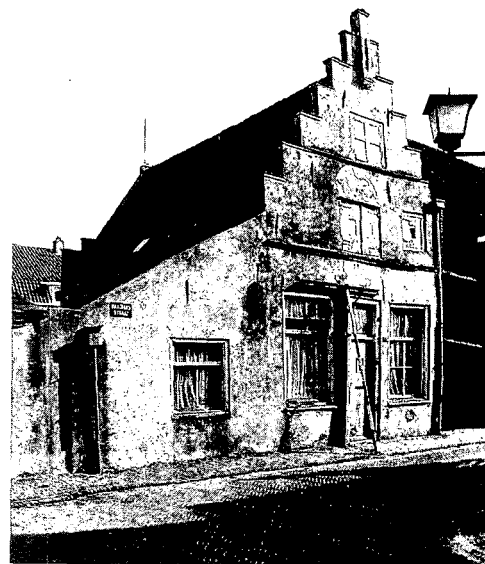
De Raadhuisstraat 22 te Naarden voor de restauratie in 1970

Het belangrijkste probleem bij de restauratie zou de vochtbestrijding zijn. Er werd gekozen voor een oplos-