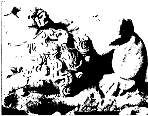
De op de Turfpoort gevonden leeuw voor de restauratie

die vanaf de toegangswegen zichtbaar zijn aangepakt worden. Maar bastion Turfpoort kreeg voorrang omdat daar het vestingmuseum in gevestigd is. Tijdens de restauratie van dat bastion werd een aardige vondst gedaan. Een leeuw van Baumberger steen, die waarschijnlijk in 1685 werd vastgemetseld en daarna voor eeuwen onder het zand verdween. Op bastion Nieuw-Molen het enige bastion dat weer helemaal in de zeventiende eeuwse vorm werd teruggebracht, werden in de schouders cirkelvormige trapjes aangetroffen, die verder nergens voorkomen. Vóór de Utrechtse Poort , de enige poort, die in zijn negentiende eeuwse vorm nog aanwezig is, werd een gedeelte van de gedempte gracht weer opgegraven en het oorspronkelijke bruggetje op de nog aanwezige bruggehoofden herbouwd.