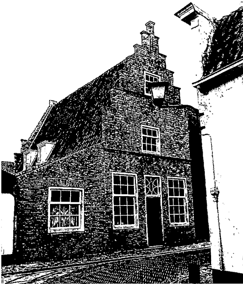
De Raadhuisstraat 22 in 1980 na de restauratie door architect C. G. Scheltema (fotostudio Vonk)