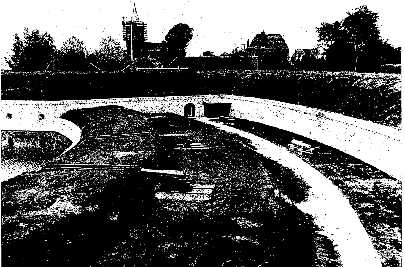
Bastion Turfpoort in 1968. De linker lage flank, zoals die na de restauratie eruit zag. De kerktoren is in restauratie en de St. Josephschool is hier nog niet afgebroken