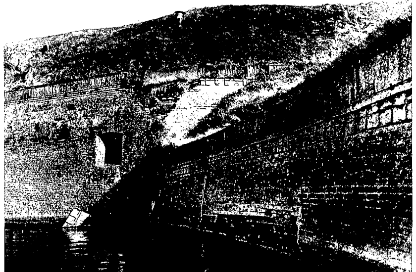
Bastion Nieuw-Molen in 1957.

aantrekkelijker, met als gevolg dat bijna alle panden in het stadje gerestaureerd of geconsolideerd zijn. Door het functioneren van de eveneens gerestaureerde Grote of St.-Vitus kerk en het ruime horeca-aanbod is het geheel bijzonder geschikt geworden voor culturele en andere manifestaties.