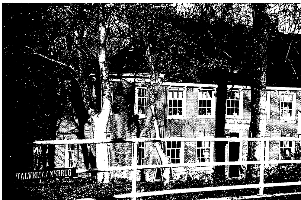
De IJsherberg in Dokkum.

Nee, ik was nog nooit in Dokkum geweest, een kleine doodzonde in het wereldje van monumentenfreaks, begreep ik. Inderdaad, wie het stadje in deze uithoek van het land bekijkt, ziet dat Nederland toch nog een stukje mooier is dan hij al dacht. Het begint al met de Afsluitdijk – nee, ook nog nooit gezien – een hindernis die je, komend van het zuidwesten, moet nemen. Maar welk een hindernis!