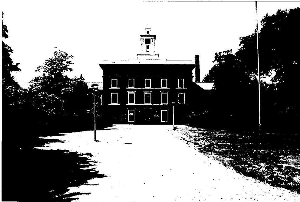
Hoofdgebouw met zijvleugels van het Provinciaal Ziekenhuis uit 1846, ontworpen door J.D. Zocher.

Pal aan de voet van de duinen in de gemeente Bloemendaal, in een groen web van lanen, ligt het landgoed Meer en Berg, een in Engelse Landschapstijl aangelegd aards paradijs. Zo'n 150 jaar lang was hier het psychiatrisch Provinciaal Ziekenhuis gevestigd. Inmiddels is een projectontwikkelaar eigenaar geworden. Wanneer binnenkort de laatste patiënten vertrekken, start een ingrijpend bouwplan. De dreigende aantasting van dit unieke landschapspark heeft veel boze reacties losgemaakt.