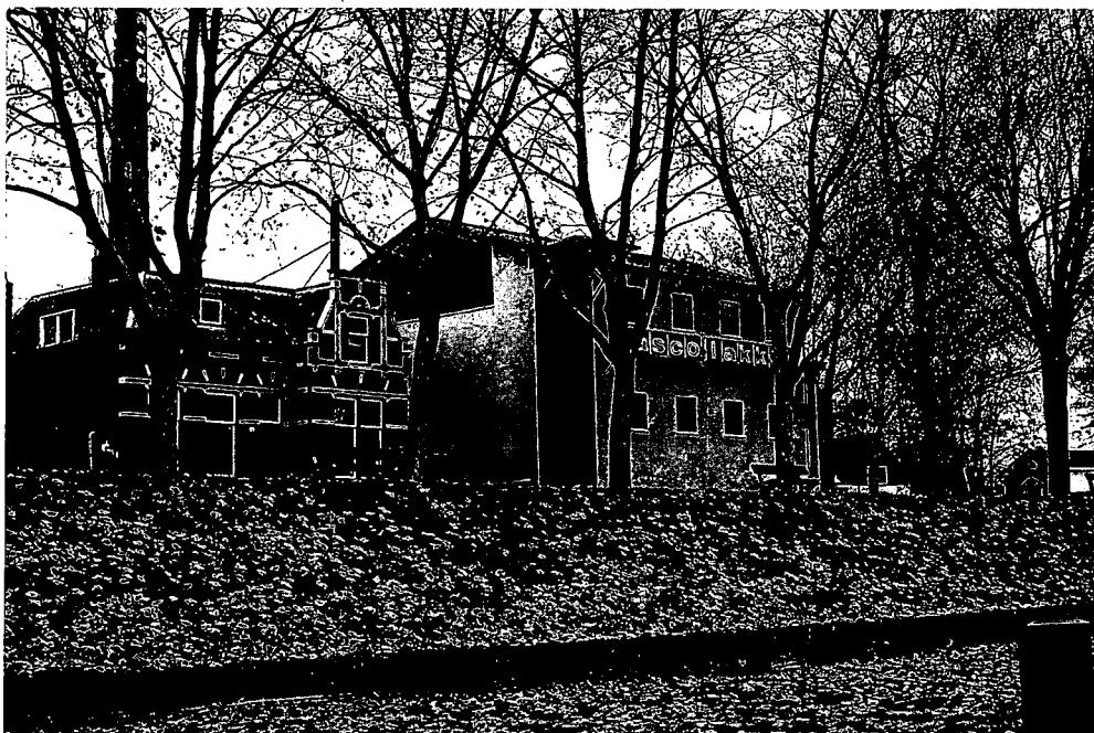
De verffabriek gezien vanaf de rivier met daarnaast de directeurswoning.

Deze gebouwen, vrijwel alle van onbestemd ontwerp, hebben deel uitgemaakt van de HASKO verffabriek. Dit bedrijf is al enkele jaren geleden naar een nieuw bedrijventerrein aan de rand van de stad verhuisd. De directie van de fabriek heeft evenwel alle grond nog in eigendom en wil zelf, in samenwerking met een projectontwikkelaar, hier een nieuwbouwplan verwezenlijken. Het spreekt vanzelf dat uit de hierop te verwachten winst de bedrijfsverhuizing althans gedeeltelijk moet worden bekostigd. Zoals zich liet voorzien zit de adder hier niet zozeer onder het gras, als wel dieper weg in de grond. Er is sprake van stevig vervuilde grond en zoals overal elders vormen de kosten die dat met zich meebrengt een fikse hindernis bij de verwezenlijking van de plannen. De gemeente zelf is heel nadrukkelijk geen partij. Ten stadhuis kan men slechts via onderhandelen, adviseren en het toepassen van de verschillende wetten en regels trachten er het beste van te maken. Bezwaren van o.a. Heemschut, maar ook van de provincie en de Rijksdienst voor de Monumentenzorg hebben al meerdere malen genoopt tot wijzigen van de plannen. Nogmaals het staat al meerdere jaren op de agenda van Heemschut Zuid-Holland.