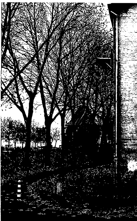
Zijaanzicht verffabriek met links op de achtergrond de rivier en de Veerpoort.

Schoonhoven krijgt eigenlijk al jaren te weinig geld om een bepaald voorzieningen-niveau te kunnen verwezenlijken dan wel handhaven. Het is voor de gemeente dan ook onmogelijk via een eigen investering in het gebied bijvoorbeeld de bebouwingshoogte omlaag te brengen of een betere aansluiting op de historische structuur te bewerkstelligen.