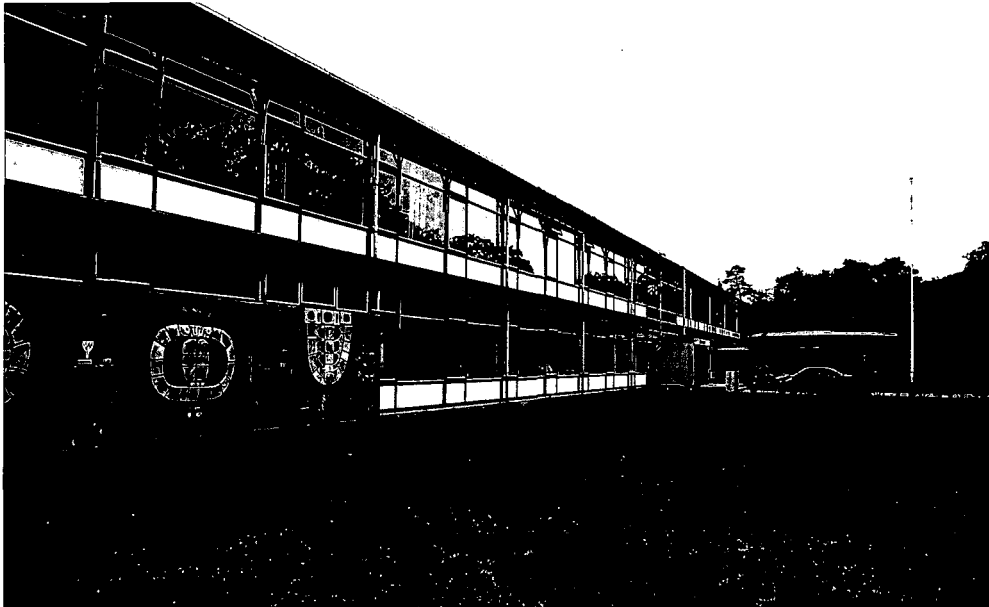
Schoolgebouw in Zeist.

Met als titel Van Cruquius tot Meerpaal werd op deze dag, georganiseerd door het Nationaal Contact Monumenten (NCM), vooral de 20ste eeuwse architectuur onder de loep genomen. Voorzitter Staal van het NCM sprak in zijn openingsrede zijn verontrusting uit over de achterstand met betrekking tot de restauratie van rijksmonumenten. Hoe vaak hebben we dit nu al niet moeten aanhoren! Er is een bedrag van 320 miljoen gulden nodig om deze achterstand in te lopen. Nu ook de Tweede Kamer op 23 maart j.l. unaniem een beroep heeft gedaan op staatssecretaris Van der Ploeg om extra middelen aan het kabinet te vragen, zou je toch mogen veronderstellen dat er in de toekomst meer geld beschikbaar komt.