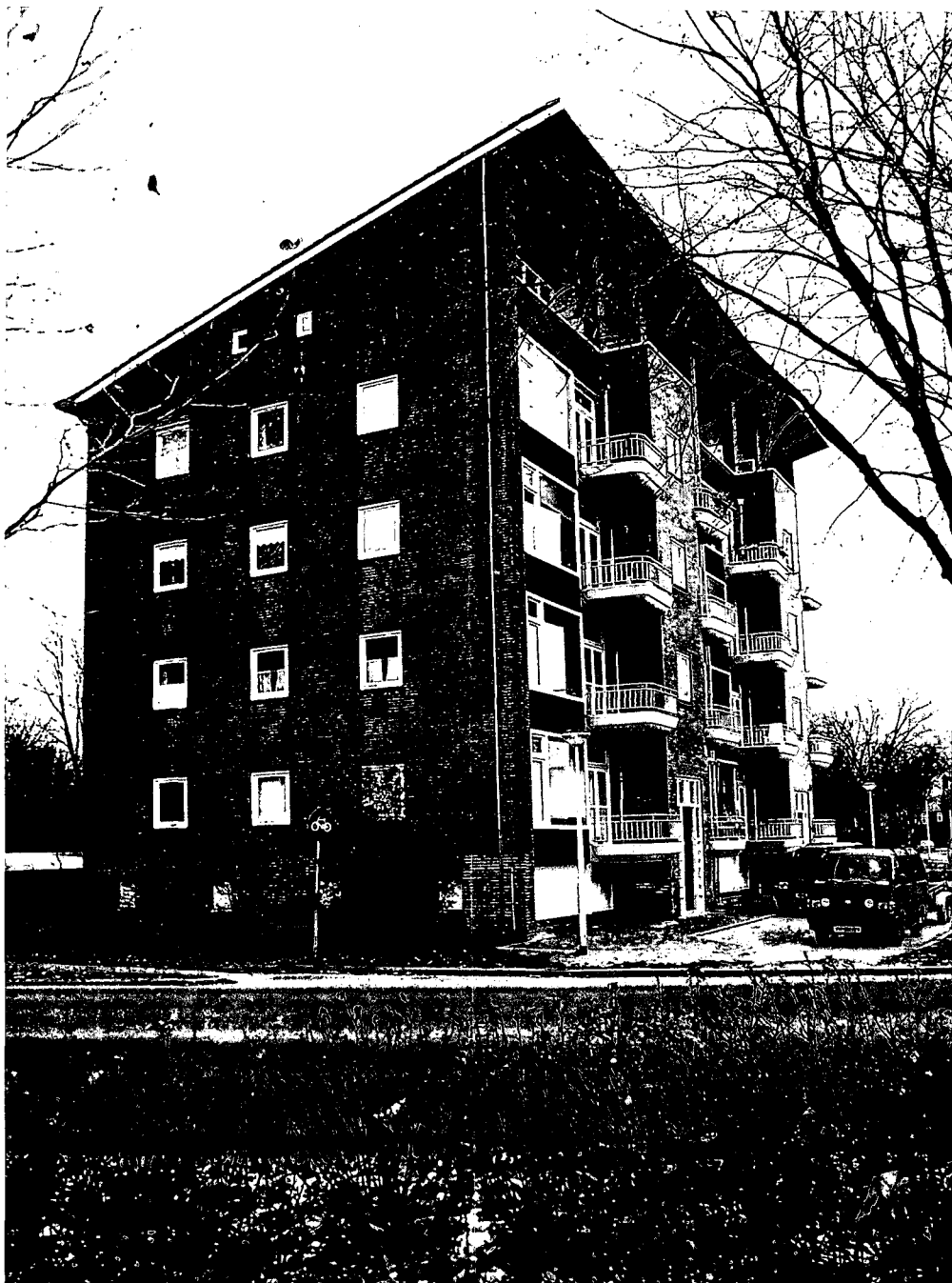
Flatbouw kort na WO II in Soesterkwartier, Amersfoort.

van door gemeenten opgestelde ontwikkelingsprogramma's. Onderzoek heeft uitgewezen dat in deze ontwikkelingsprogramma's het aspect cultuurhistorie nauwelijks en onvoldoende meegewogen wordt.