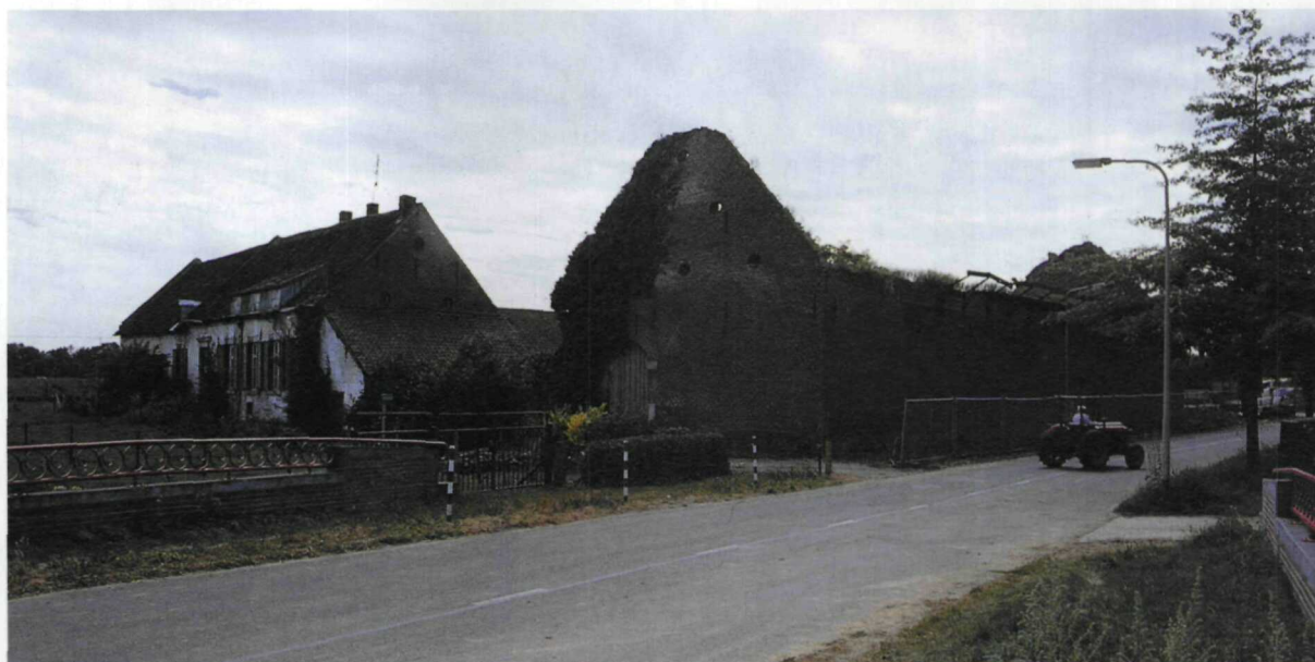
Cadavre exquis De Biesenhof, visitekaartje van de gemeente Geleen.

De Commissie Limburg van de Bond Heemschut heeft reeds in 1995 haar bezorgdheid over de gang van zaken rond de Winneberg aan de gemeente Vaals kenbaar gemaakt. Het college liet weten deze zorg te delen, maar schoof iedere verantwoordelijkheid af naar de provincie, omdat die bleef vasthouden aan de agrarische bestemming van de hoeve en niet wilde zoeken in de richting van een eventuele oplossing van ombouw tot toeristisch appartementencomplex. Deze verklaring van de gemeente zou voor Heemschut nog acceptabel zijn geweest als er niet veel meer gevallen waren waar-