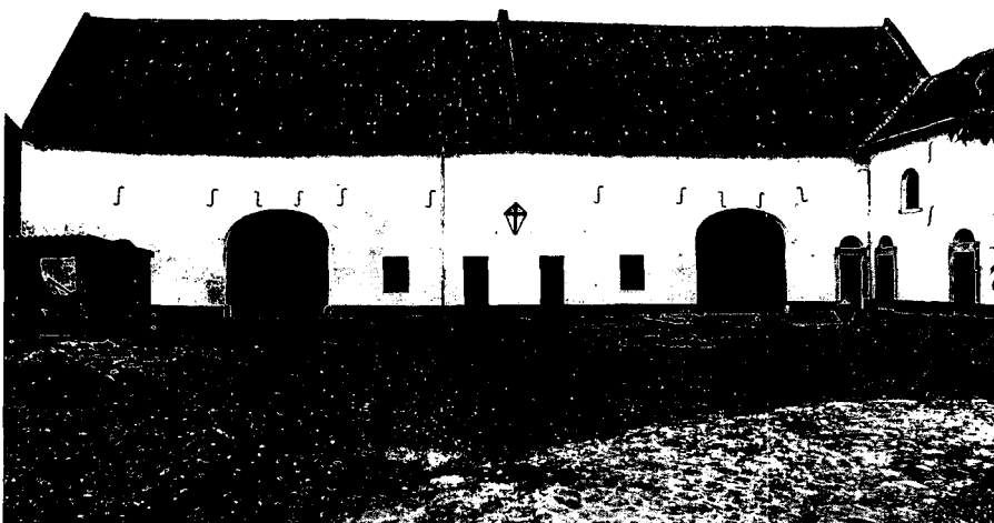
De binnenplaats van Kasteel Haeren in augustus 2000 (boven) en oktober 1986 (onder). De gemeente Voerendaal beschouwt de garage als een voortzetting van het bouwvallig schuurtje links op de foto.

uit een ernstig gebrek aan krachtadig optreden van de zijde van het gemeentebestuur bleek met betrekking tot de bescherming van monumenten. Lankmoedig, dat is nog de meest vriendelijke typering voor het monumentenbeleid van Vaals. Bij de Winneberg uit zich dat in het tolereren van de zonder vergunning opgetrokken bijgebouwen en de aanleg van de geïmproviseerde parkeerplaats. Er moet bovendien ernstig getwijfeld worden aan het tijdelijke karakter van zowel de bijgebouwen als de parkeerplaats. Van een gemeente waarvan de burgemeester historica is en bovendien als voorzitter van het Monumentenhuis Limburg van het belang van monumenten niet overtuigd hoeft te worden, mag je een veel alerter beleid verwachten. Mevrouw Quint-Maagdenberg mag dan wel op studiedagen van leer trekken tegen de hogere overheid (zie 'Heemschut' juni 2000, pag. 6), dit pleit haar niet vrij van een blik in eigen keuken.