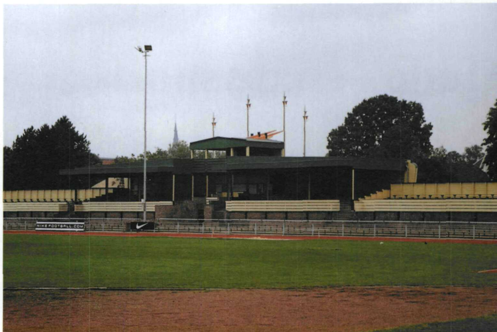
Het sportstadion van Dudok.