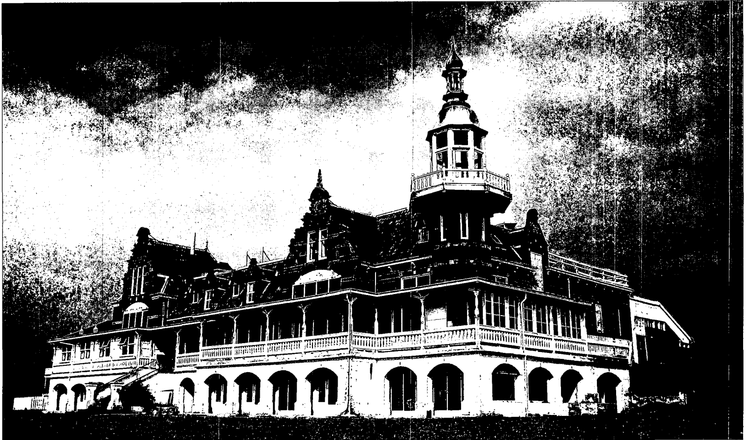
Het Badpaviljoen in de huidige staat.