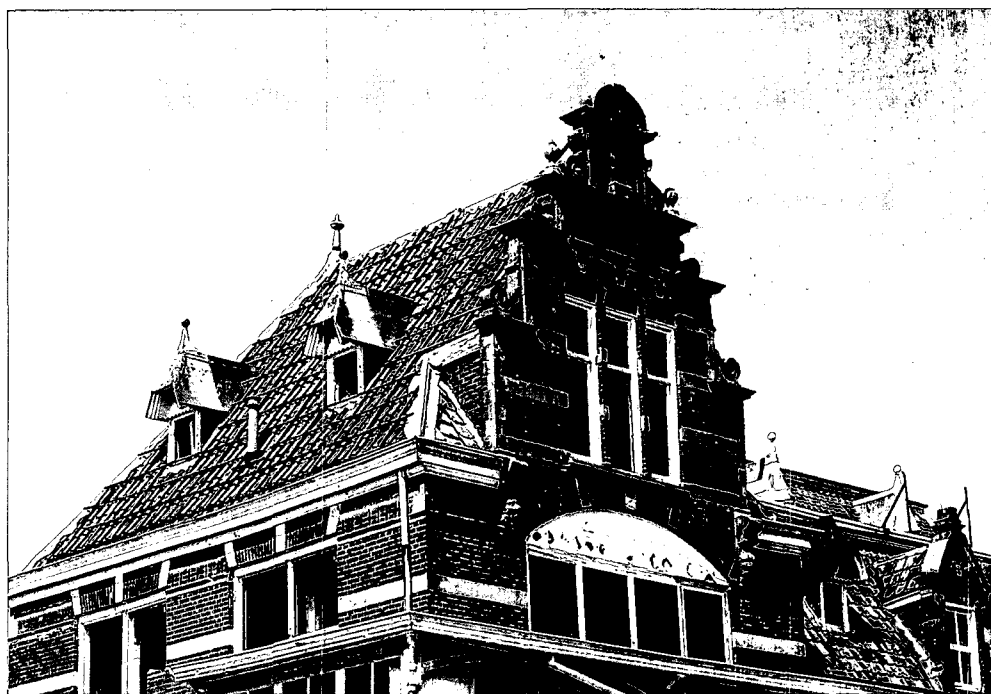
De neo-renaissance hoekgevel.

Nieuw-Amelisweerd in Utrecht. Verder staat de restauratie van het Kurhaus in Scheveningen op zijn naam. In Domburg wil hij zich voor de restauratie van het badpaviljoen inzetten om het authentieke karakter te bewaren. Deze visie heeft zich langzaam ontwikkeld tot de Methode Hoogenberk. Concreet vertaald wil dit zeggen dat hij zo weinig als mogelijk is in Domburg wil vernieuwen. 'Met respect voor het verleden gaan we in Domburg ook naar de zeezijde toe uitbreiden. Hier gaan we ook veertien meter de lucht in. Dit is nodig om de exploitatie op korte en langere termijn mogelijk te maken. We zijn er hierbij erg attent op, dat het materiaal, de kleurstelling en de sfeer bij het huidige