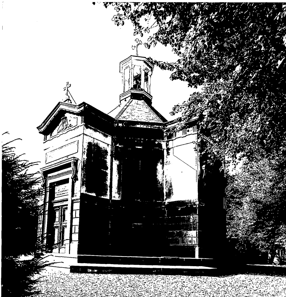
De neoclassicistische kapel.

Beneden aan de steil aflopende Vlaardingerdijk te Schiedam ligt een oude, 19de-eeuwse begraafplaats. Er staan monumentale bomen, ruïneuze grafbeelden, scheefstaande, met mos begroeide grafzerken, priester- en nonnengraven, een kapel en wat bijgebouwen. Sinds de jaren '70 wordt hier niemand meer begraven. Daardoor verloren ook de neoclassicistische kapel en de bijgebouwen hun functie. Sloop dreigde. Dankzij de inspanningen van de Stichting Beschermd Stadsgezicht Schiedam bleven ze behouden.