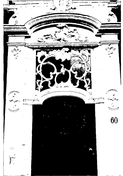
Een nieuw ontworpen snijraam (1973) in een gevel in Haarlem.

Vanaf de 17de eeuw kenmerken de Nederlandse huizen zich meer en meer door een bijna overmatig gebruik van glas in de gevel. In al die ramen de zo bekoorlijke roede-verdeling, de houten kozijnen, de deuren eronder, de verf: donker groen, helder wit, bentheimer.... Geen wonder dat er uit dit geheel een traditie ontstond, een behoefte, om boven de deur op