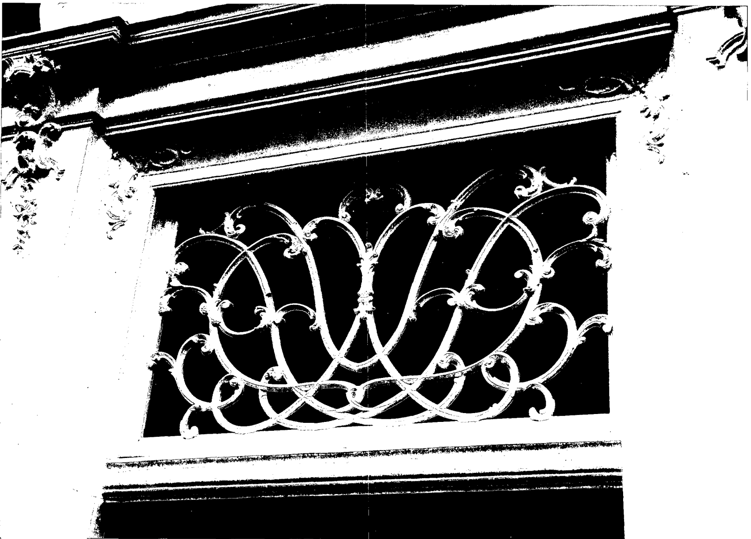
Reconstructie (1983) van een snijraam naar een oude foto (Hoorn).

gaten boven de voordeuren van heel veel prachtige panden. Wat een disharmonie met het karakter van de gevel!