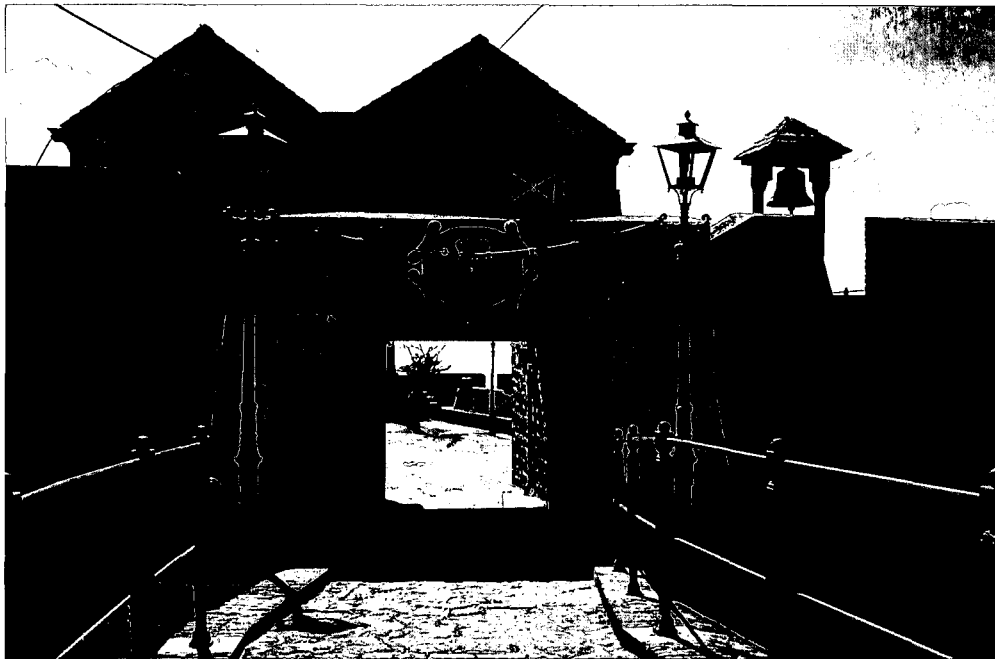
Entree Fort Oranje. Het poorthuis bestaat uit twee kleine huisjes en diende vroeger als woning van de commandant.

In 1682 wordt Sint-Eustatius een compagnieskolonie als onderdeel van de Westindische Compagnie, geadmistreerd door de Kamer van Zeeland. Statia ontwikkelde zich op economisch terrein voorspoedig dankzij de gunstige ligging ten opzichte van de omringende Franse, Spaanse en Engelse koloniën. Deze landen mochten van de moederlanden niet met elkaar handel drijven. Daar het moeilijk was de koloniën vanuit Europa goed te bevoorraden, omzeilde iedereen deze wet, wat voor Sint-Eustatius zeer gunstig uitpakte.