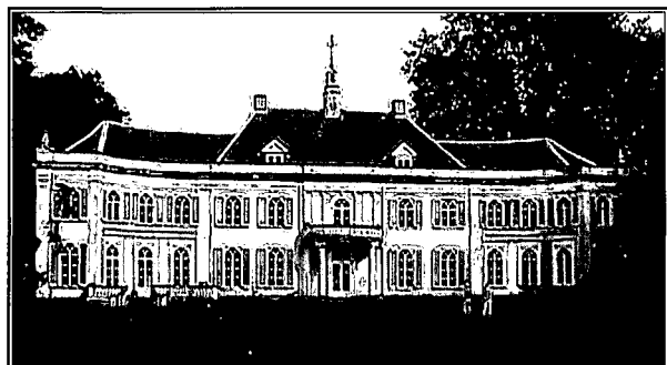
Restauratie "Huis Landfort" te Megchelen. Architect: Architectenbureau Bob C. van Beek BV, te Leiden

Landelijk erkend S.V.R. restauratiebedrijf