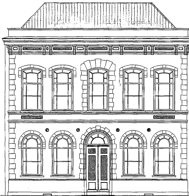
Tekening architect G.N. Itz. Voorgevel poortgebouw 1871 met ingangspartij aan de Nieuwstraat.