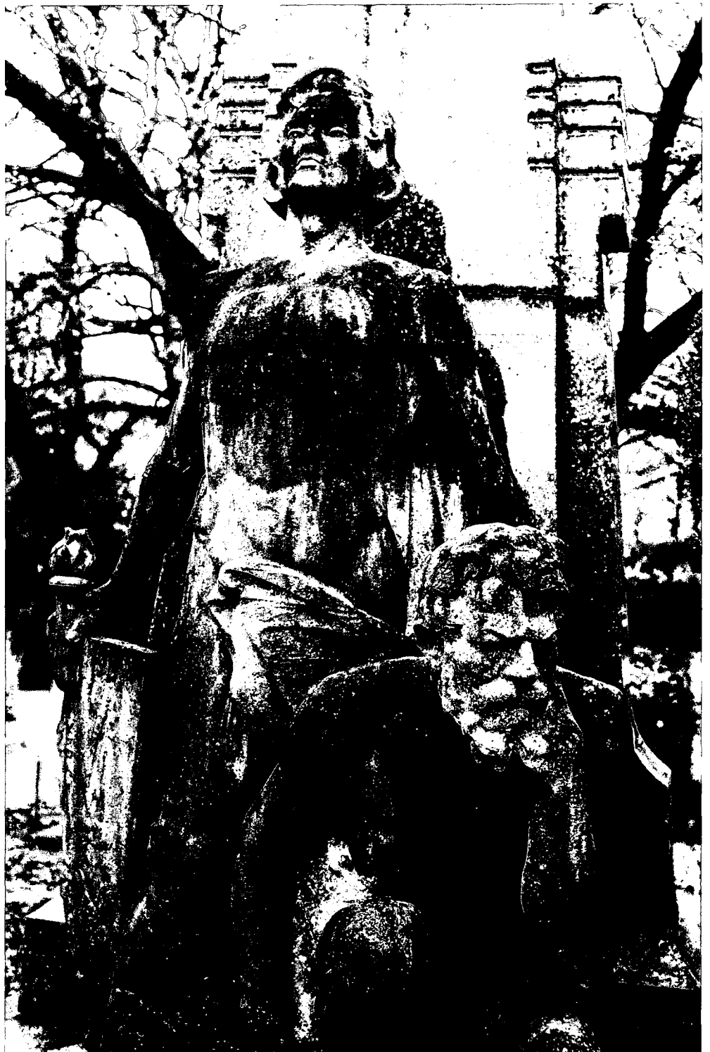
Zutphen. Monument voor ir. A. van Hasselt, eind 19de eeuw betrokken bij de bouw van de spoorbrug over de IJssel en opgericht door werknemers van een spoorwegmaatschappij in 1908.

Soesterberg, Uitgeverij Aspekt BV, 2002. 96 p. ISBN 90 5911 057 9 Prijs ca € 10 per deeltje.