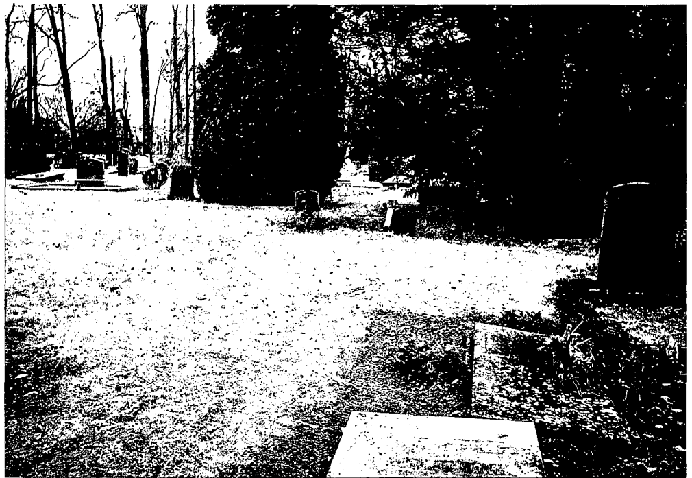
Begraafplaats in Zutphen. J.D. Zocher richtte deze in als landschapspark. De lichte gedenk- stenen steken af tegen het donkere geboomte.

De LOB is een landelijk organisatie, die eige- naren (gemeenten en kerkgenootschappen) van begraafplaatsen verenigt en door middel van